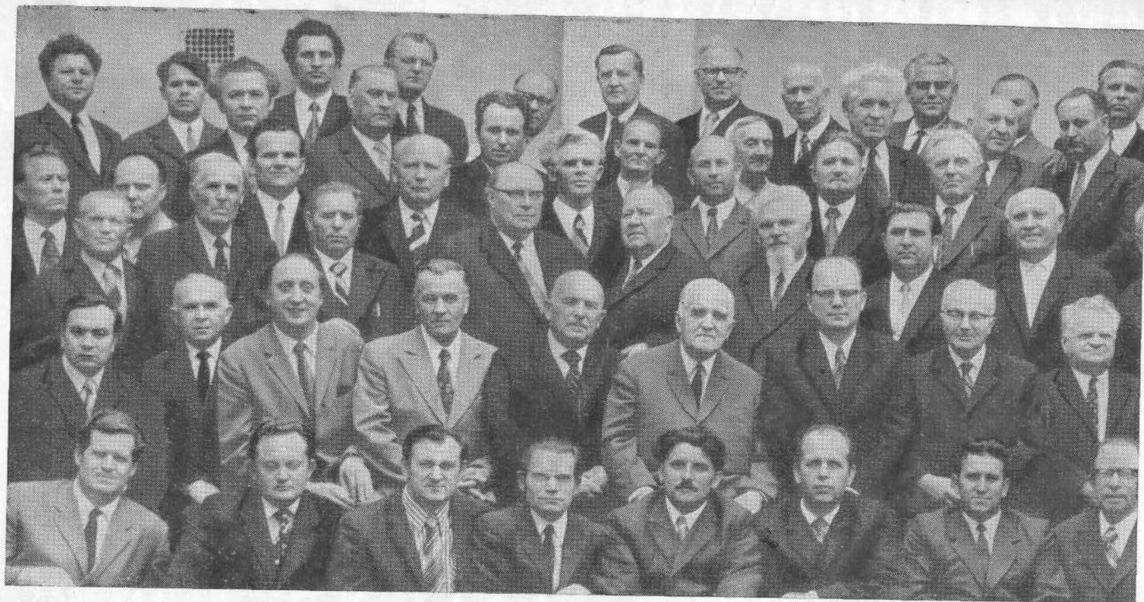
Участники Пленума ВСЕХБ. Июль 1974 г.