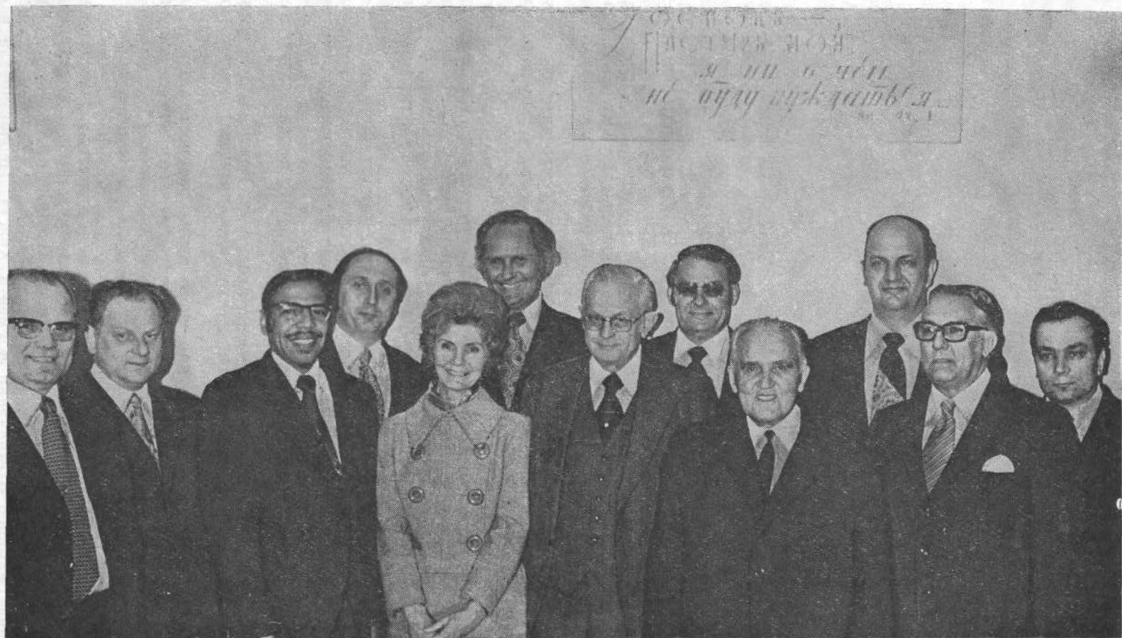
Представители баптистских и пятидесятнических церквей США в канцелярии ВСЕХБ