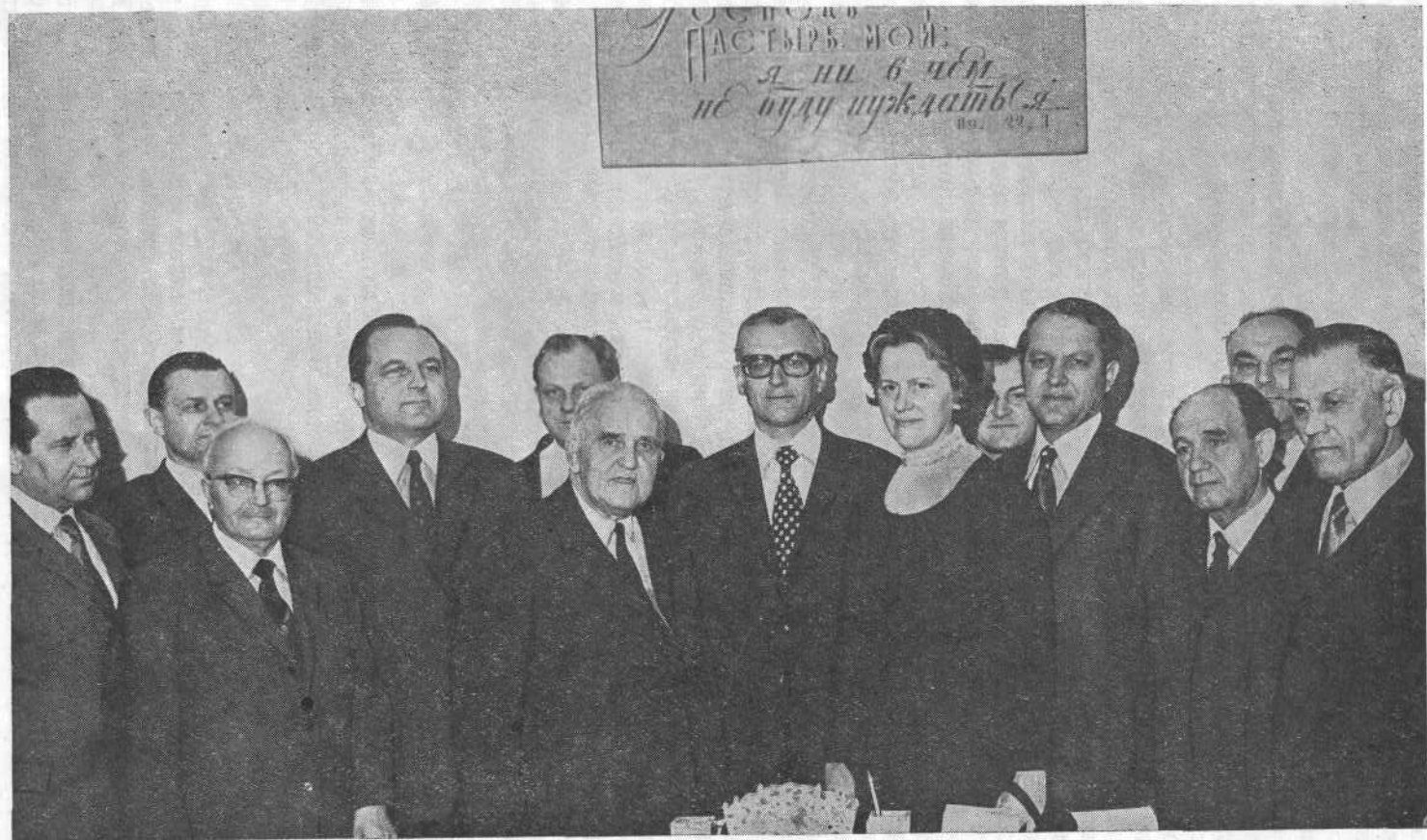
Делегация Союза баптистов ФРГ в канцелярии ВСЕХБ.