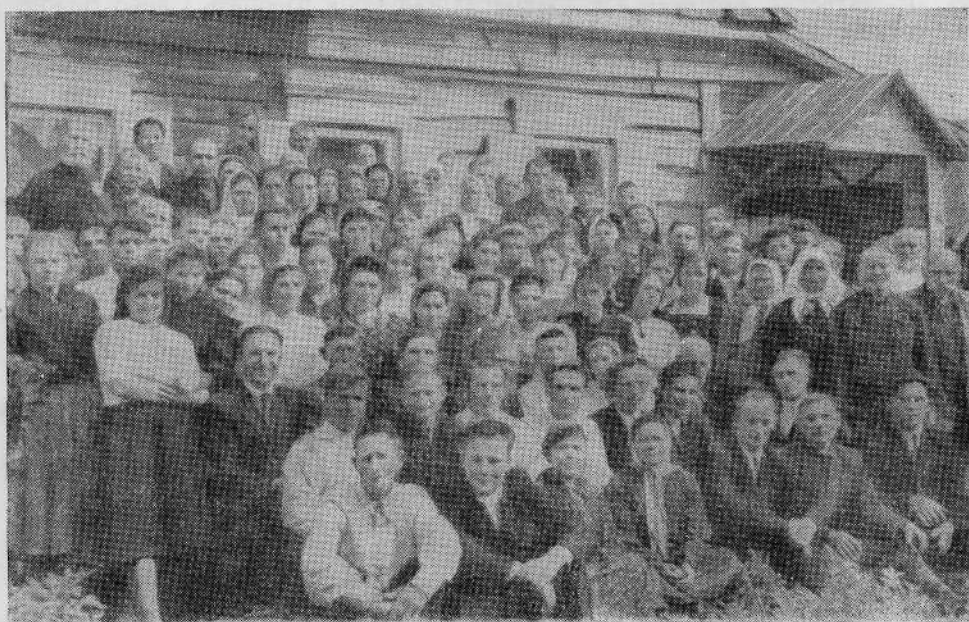
Гомельская община евангельских христиан-баптистов.

сти претерпел крест. Он есть Вождь наш во веки веков; пойдем за Ним, как овцы за любящим и добрым Пастырем, умершим и воскресшим, и находящимся перед престолом Бога-Отца, и будем слушать Его слова: «Да будут все едино; как Ты, Отче, во Мне, — Я в Тебе, так и они да будут в Нас едино; да уверует мир, что Ты послал Меня и славу, которую Ты дал Мне, Я дал им; да будут едино, как Мы едино» (Иоан. 17, 21, 22).