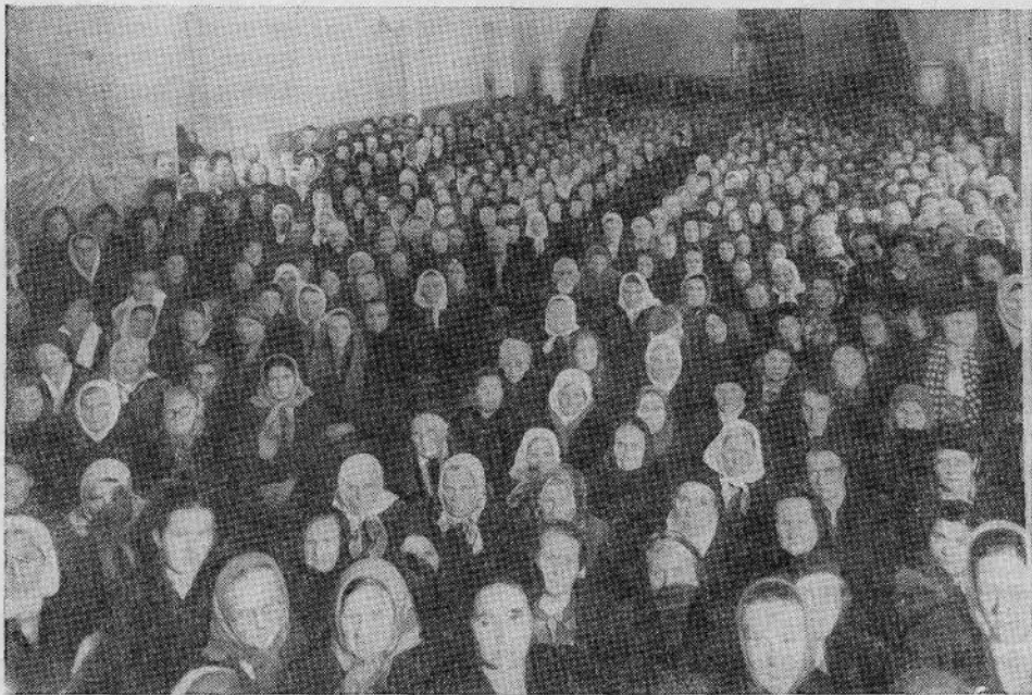
Собрание Ленинградской общины евангельских христиан-баптистов.

Конец Саула. Прочтем 1 Цар. 31, 1—6. «Саул взял меч свой и пал на него!» То есть покончил самоубийством! Как и отступник Нового Завета—Иуда.