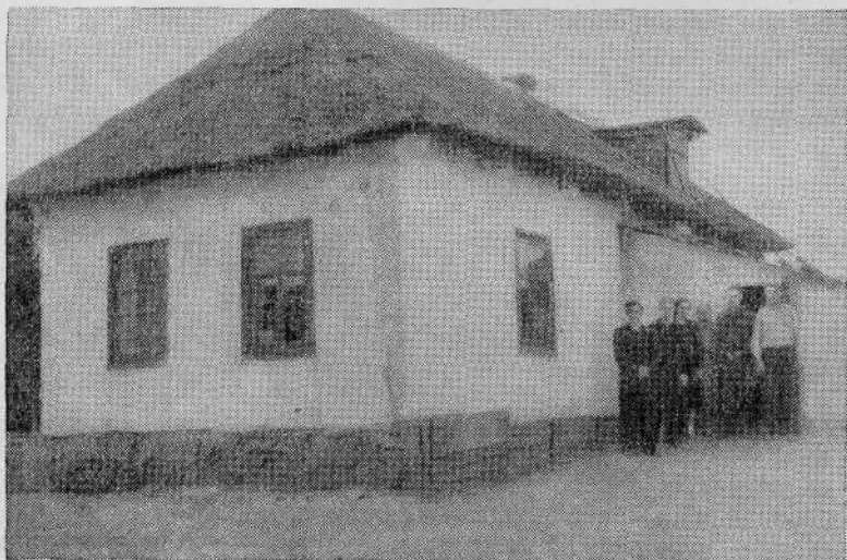
Молитвенный дом Сретенской общины Белгородской обл.