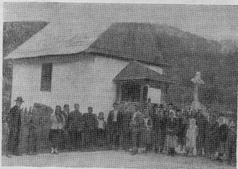
Молитвенный дом и община села Русско-Мокра Закарпатской области.

Генеральный секретарь Союза баптистов СССР