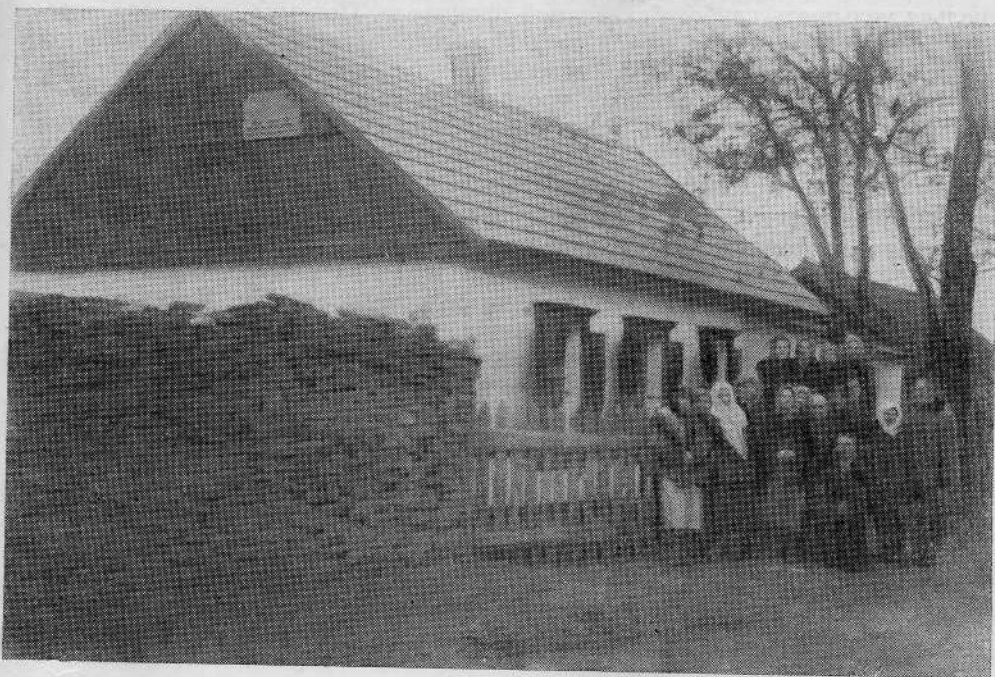
Молитвенный дом Ольховской общины Ворошиловградской обл. Успенский р-н, пос. Водино.