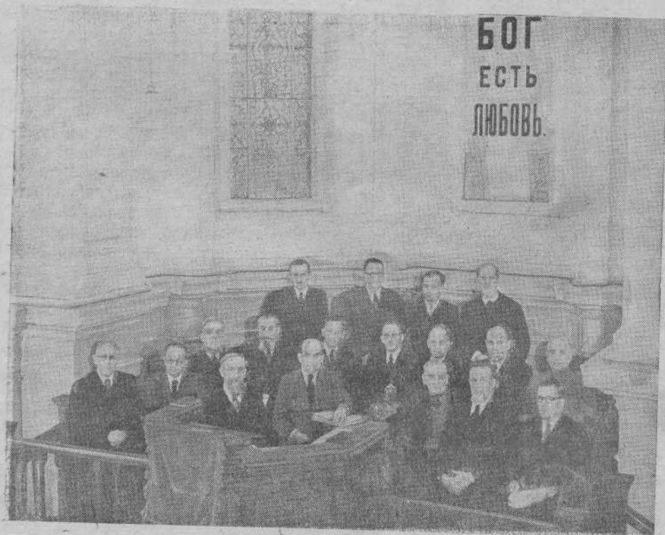
Участники расширенного совещания ВСЕХБ