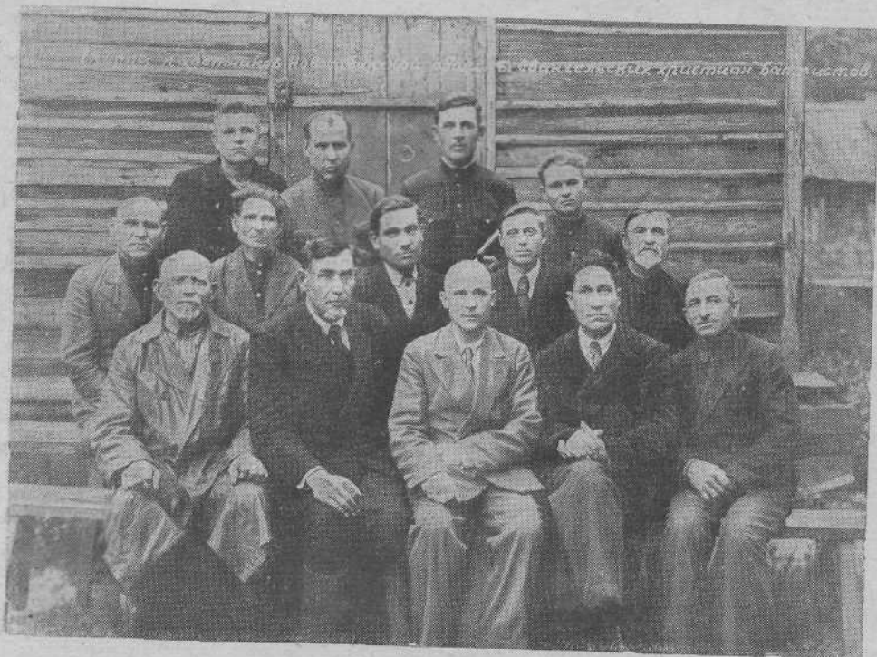
Работники Новосибирской общины евангельских христиан-баптистов