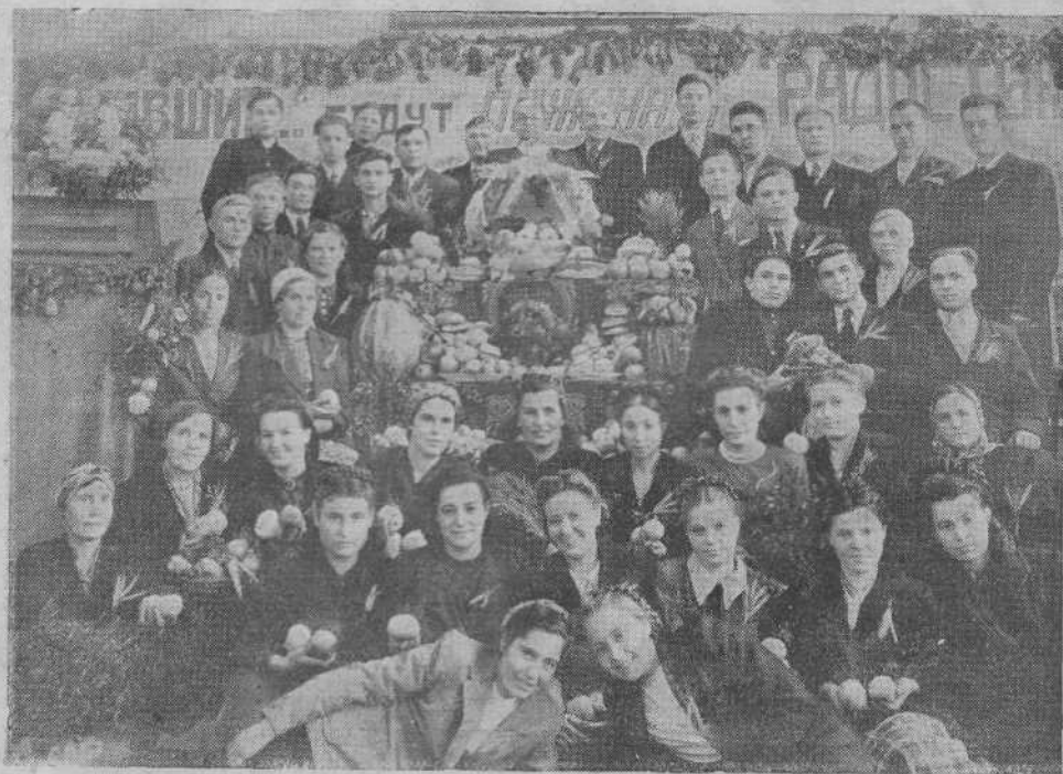
Праздник жатвы в Киевской общине евангельских христиан-баптистов