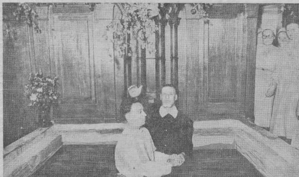
Крещение по бере в Московской общине евангельских христиан баптистов