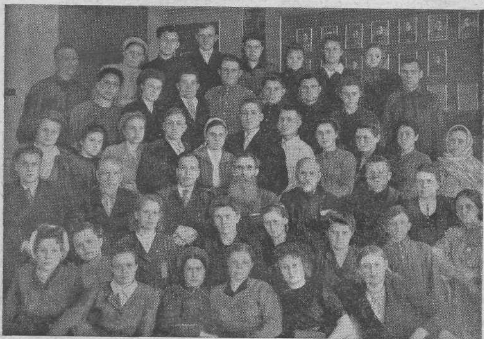
Хор Красноярской общины евангельских христиан-баптистов