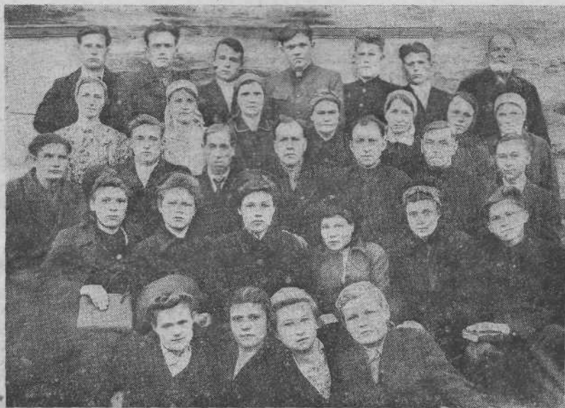
Хор Абаканской общины евангельских христиан-баптистов (Красноярский край)

Снова в Абакане. Нельзя описать чувств, пережитых верующими на прощальном собрании, которое продолжалось несколько часов. К поезду меня провожали многие братья и сестры. Когда поезд тронулся, все они замахали белыми платочками. Молю Господа, чтобы Абаканская община была готова еще с большей радостью встретить Его пришествие.