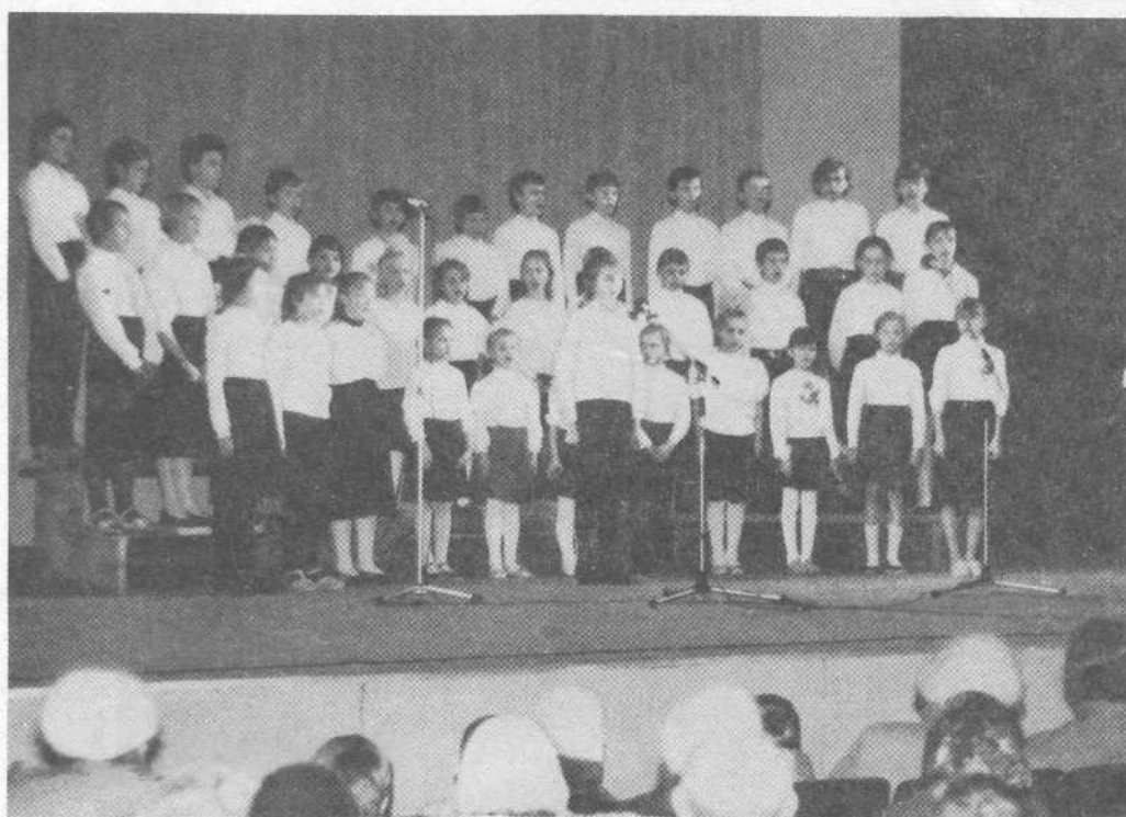
Подростковый хор выступает на евангелизационном собрании

широкую и полноводную реку Волгу, принимавшую их как свидетелей необыкновенного события в жизни народа Божия.