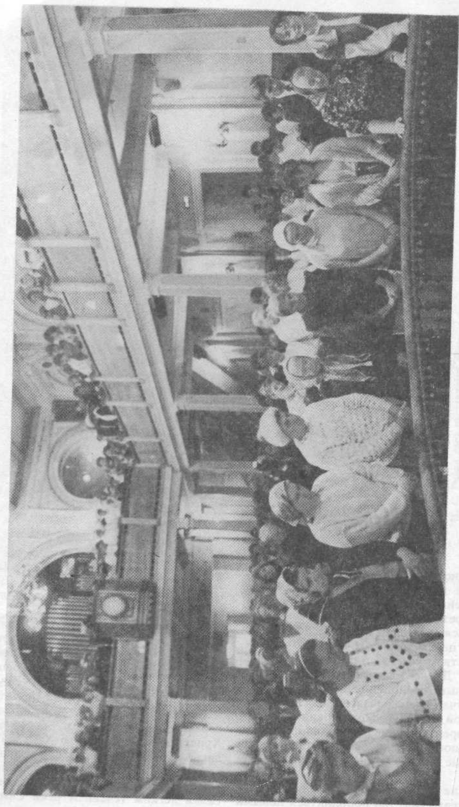
Богослужение в Московской церкви. На переднем плане новые члены церкви