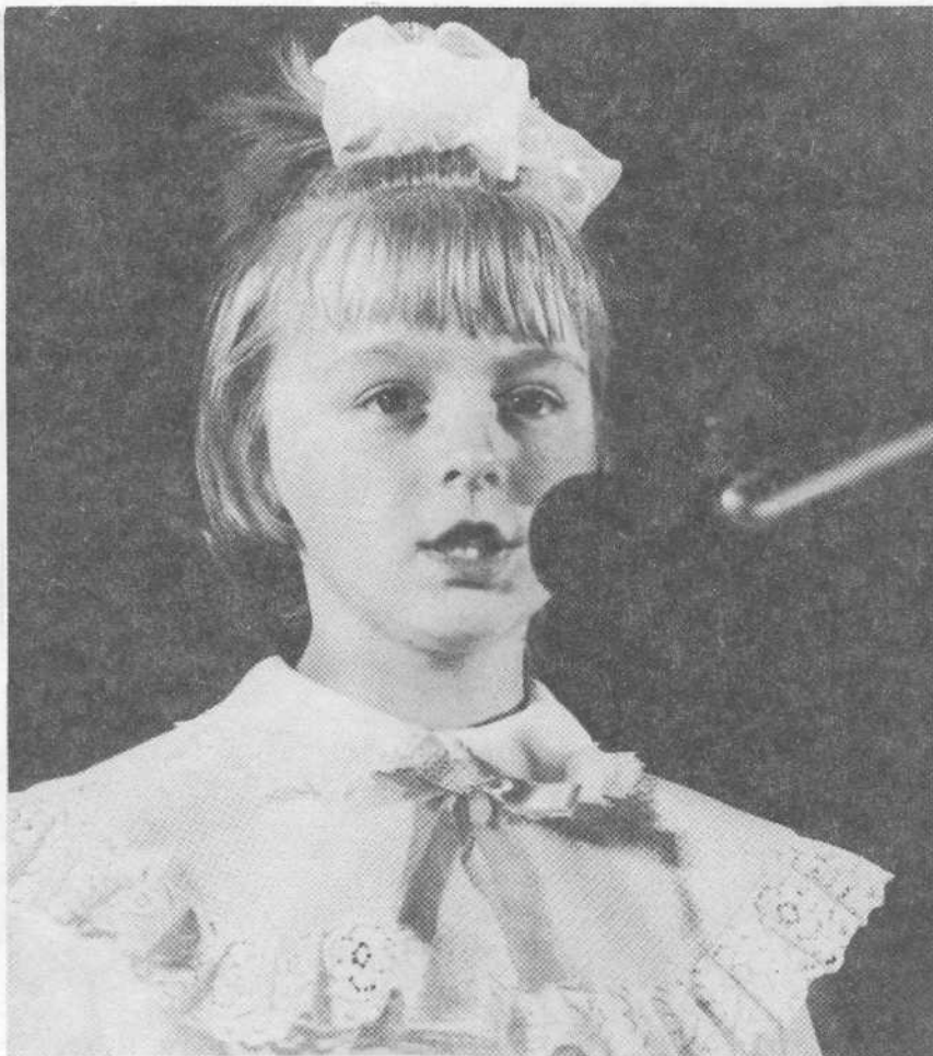
«Из уст... детей Ты устроил хвалу»