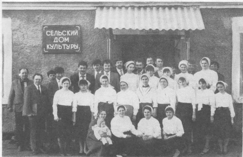
Группа верующих перед проведением евангелизационного собрания в поселке Ныркове Луганской области

посещают. Также помогают мне духовной литературой донецкие братья, высылают газету «Слово Веры», вообще помогают, кто чем может. И помощь эта своевременна. Потому что во время изучения у меня возникает много неясностей и вопросов, с которыми я часто обращаюсь к братьям и сестрам. Совсем недавно, к большой моей радости, один брат подарил толкование на пятикнижие Моисея Г. Х. Макинтоша. Вот как заботится обо мне мой Господь, также и через Вас. Ваши журналы для меня чрезвычайно интересны и полезны, ибо содержат многое из того, что сейчас особенно мне необходимо.