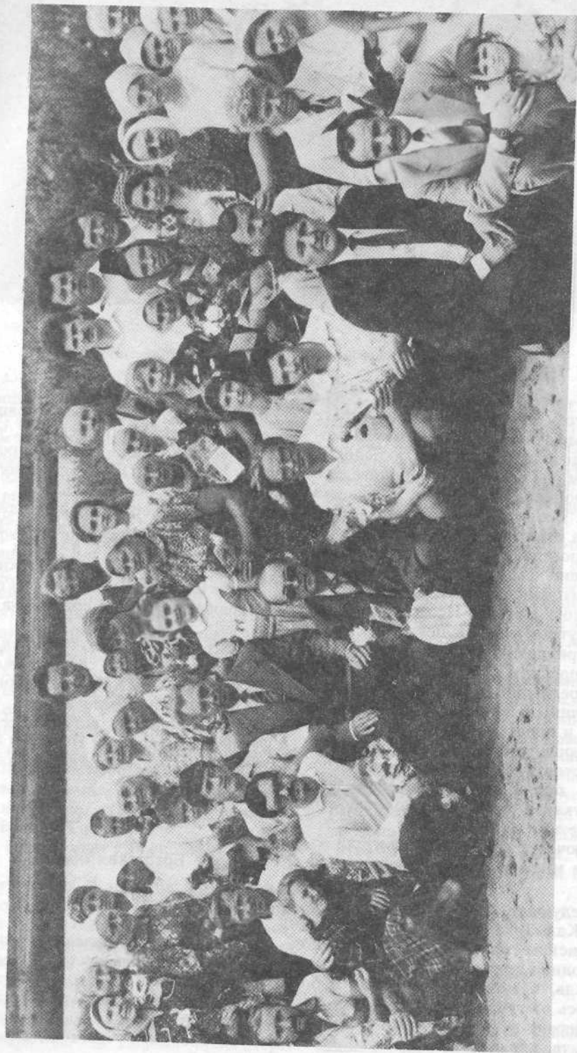
После крещения новых членов Кустанайской церкви