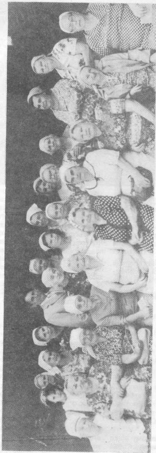
Женский кружок Центральной церкви города Харькова вместе с пресвитером церкви.