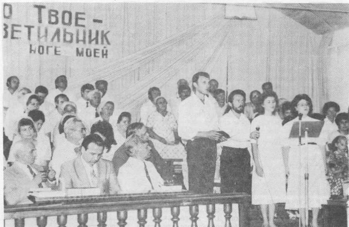
Богослужение во второй Алма-Атинской церкви

здесь крещение. Известие об этом стало большой радостью для меня. Истинно верен Обещавший, ибо Он сказал: «Просите, и дано будет вам; ищите, и найдете; стучите, и отворят вам; ибо всякий просящий получает, и ищущий находит, и стучащему отворят» — Лк. 11,9—10.