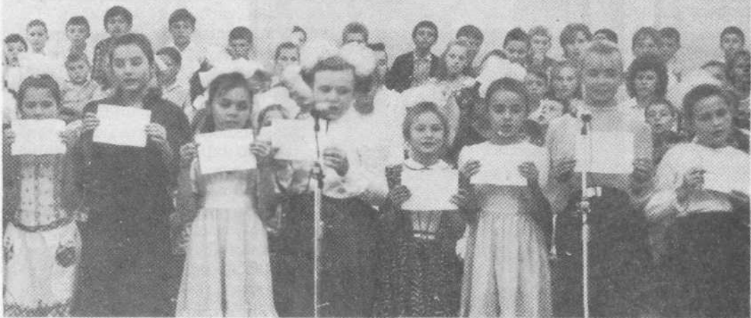
Учащиеся воскресной школы церкви города Мелитополя

молитвы группа молодых братьев и сестер поздравила крещаемых с памятным для них днем и преподнесла им цветы.