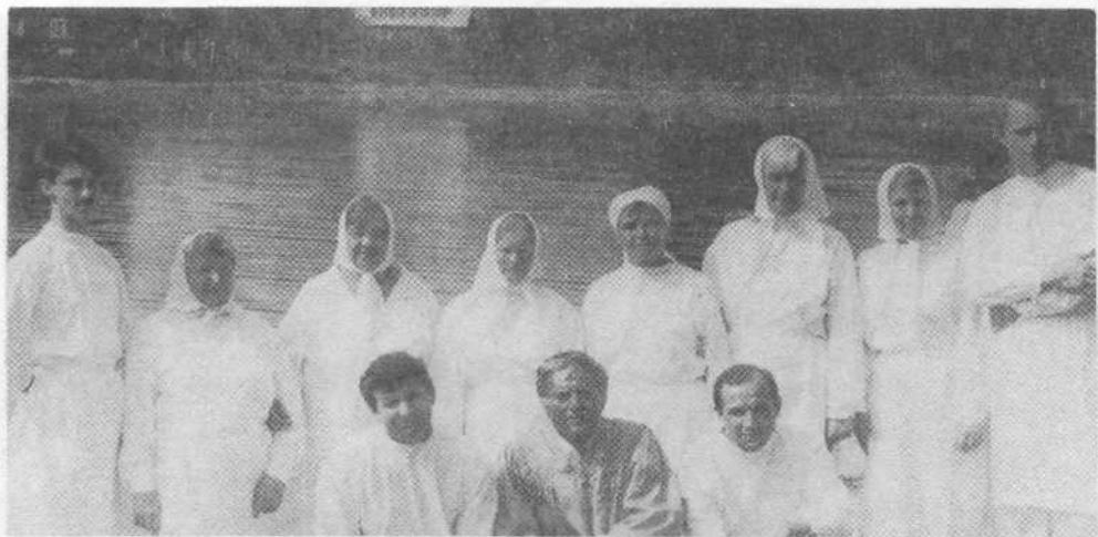
Крещаемые новой церкви поселка Колодищ

чал и о том, что проповедь о Христе можно слышать в церквях и домах молитвы, во дворцах культуры и больницах, в парках и на стадионах. Проповедь о Христе проникает в учебные заведения и тюрьмы. Все это подтверждает истинность слов Христа о том, что Евангелие будет проповедано по всему лицу земли. В заключение брат прочитал слова из Священного Писания: «Покайтесь, ибо приблизилось Царство Небесное» и призвал присутствующих к покаянию.