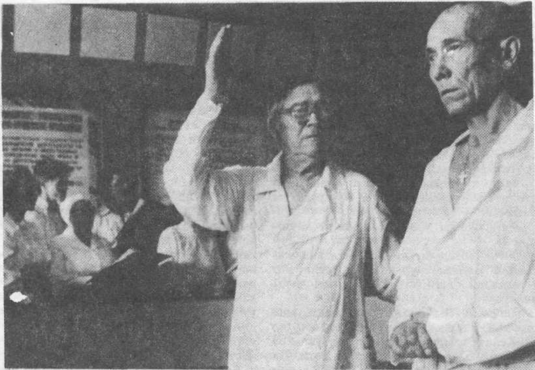
Крещение в Казанской тюрьме

шего Иисуса Христа да пребудет с Вами всегда.