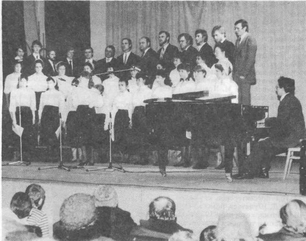
Хористы поют во славу Господа на евангелизационном собрании

неба. Выступающий упомянул имена и тех служителей, которые длительное время трудятся на ниве Божией поместной церкви.