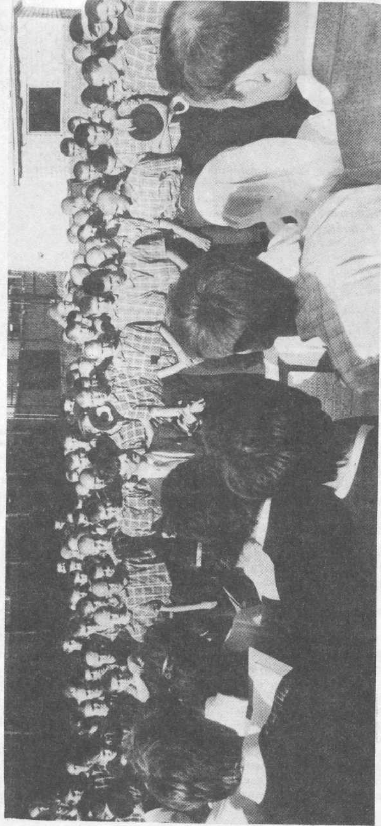
Евангелизационное служение в подростковой колонии города Казани