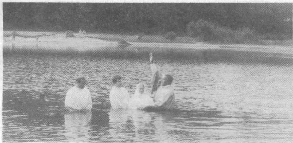
Крещение в церкви поселка Колодищ Минской области

Проповедь Слова Божия, пение хора, игра духового оркестра, — все это было добрым посевом для тех, кто еще не принял Иисуса Христа в свое сердце.