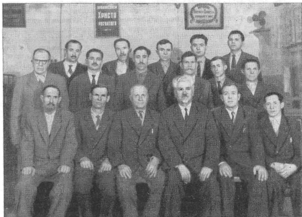
Руководство Томской церкви ЕХБ

Ваше сердце, как и Ваши плечи, было всегда широким, чтобы вмещать всех любящих нашего Господа Иисуса Христа и тем самым содействовать единству всех христиан на земле. Мы радуемся и благодарим нашего Господа, что при большой се-