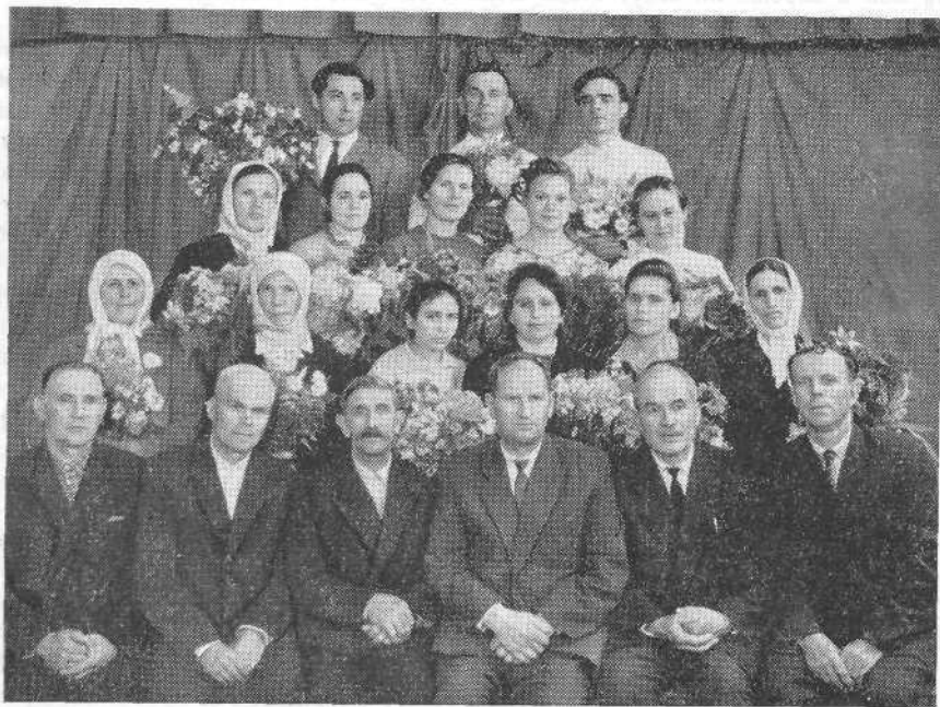
Четырнадцать человек верующих из Черкасской общины, принявших крещение в Днепре