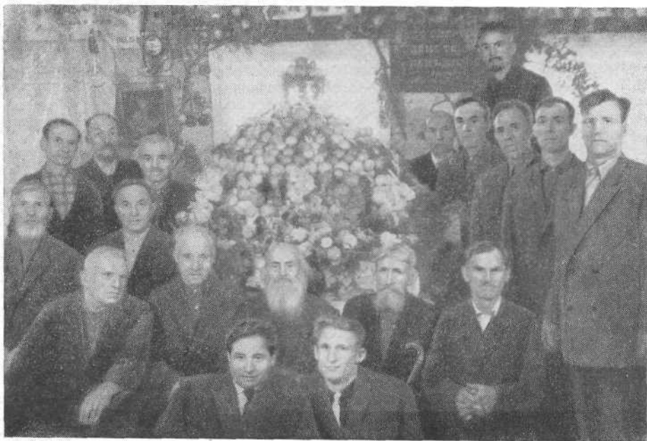
Руководящие братья Выксинской церкви, Горьковской области. Праздник жатвы

По своему национальному составу Кантская община является смешанной, состоящей из верующих русской и немецкой национальности.