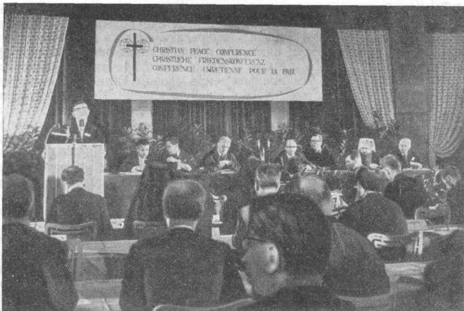
Заседание Совещательного Комитета Христианской Конференции Мира в октябре 1965 года в Будапеште

жений. Поэтому мы поддерживаем все усилия правительств, ООН и мирных организаций, предпринимаемые в этом направлении.