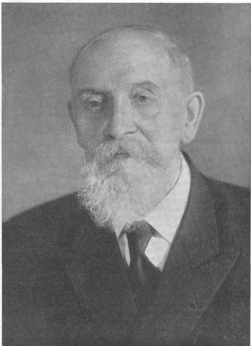
Председатель ВСЕХБ Яков Иванович Жидков

у всех нас было много печалей и скорбей, но вместе с тем и много радостей и Божиих благословений, которые мы должны всегда помнить.