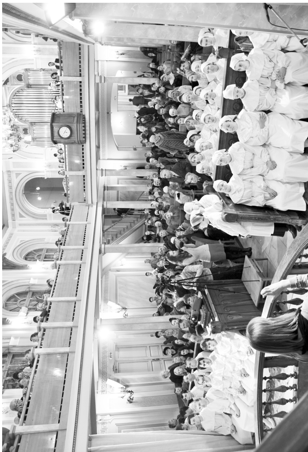
Крещаемые на богослужении в Центральной Московской церкви