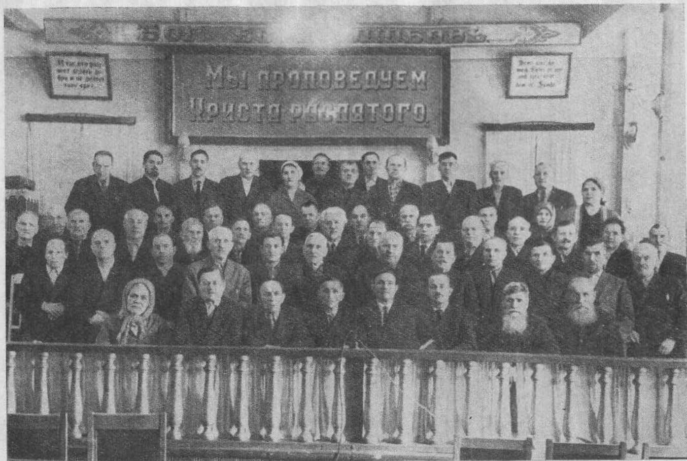
Совещание пресвитеров и других служителей церкви в Новосибирской общине