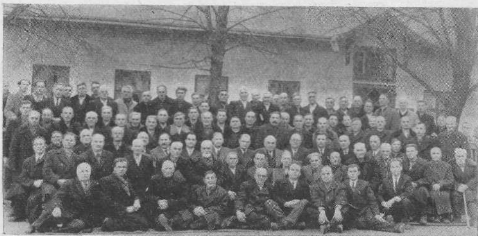
Совещание пресвитеров и других служителей церкви Черновицкой области. В центре — генеральный секретарь ВСЕХБ брат А. В. Карев

с любовью к Вам, служители церкви ЕХБ Винницкой области.