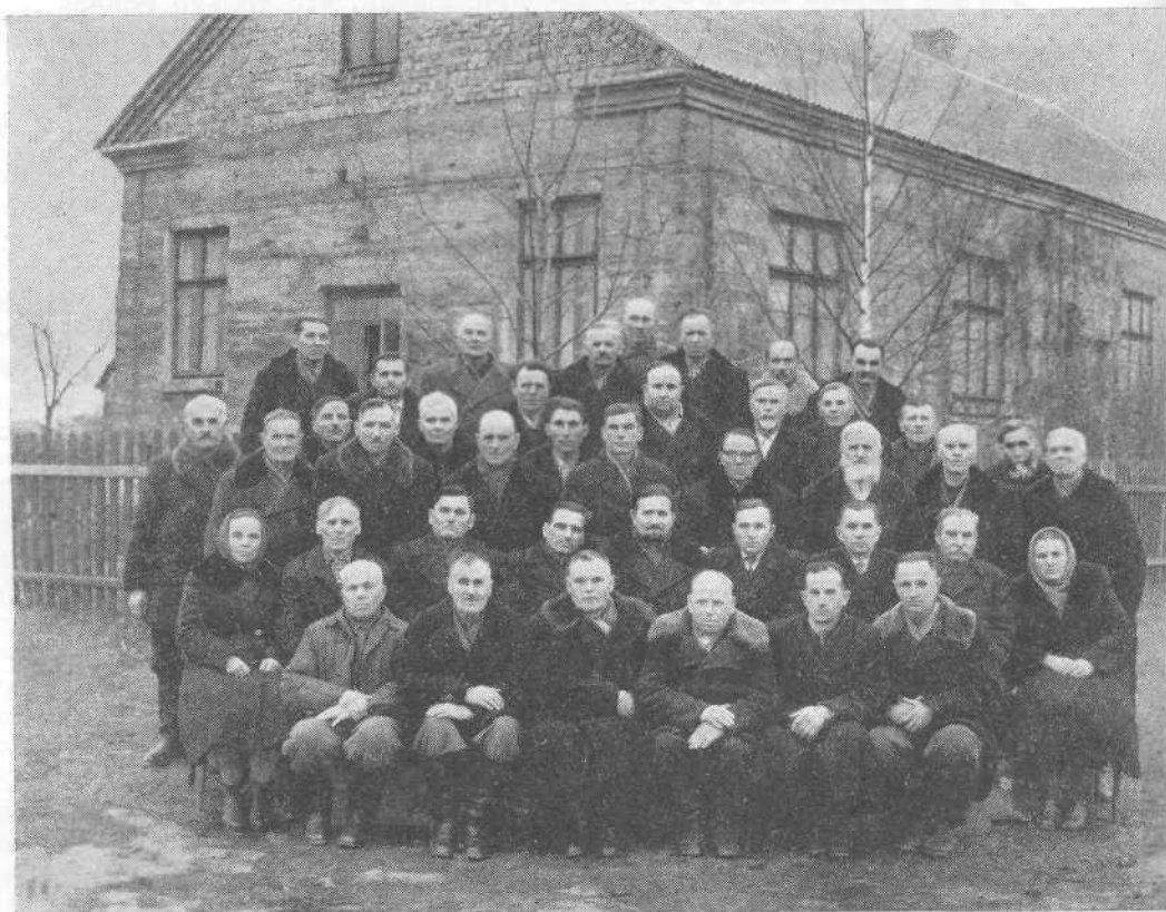
Совещание пресвитеров и других служителей церкви Волынской обл. в Ковеле