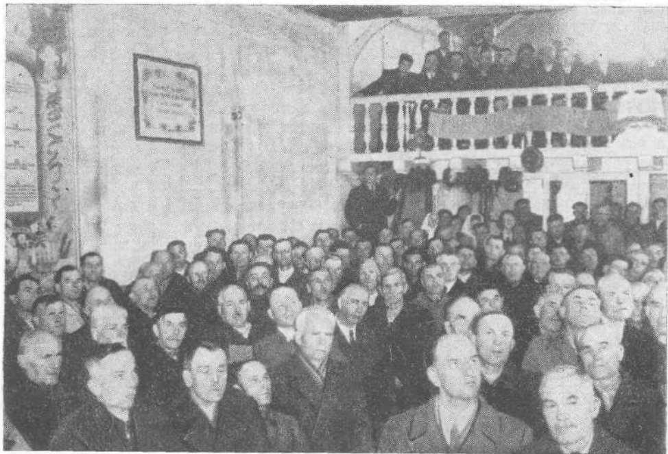
Совещание пресвитеров Черновицкой и Ивано-Франковской областей

ВСЕСОЮЗНЫЙ СОВЕТ ЕВАНГЕЛЬСКИХ ХРИСТИАН-БАПТИСТОВ