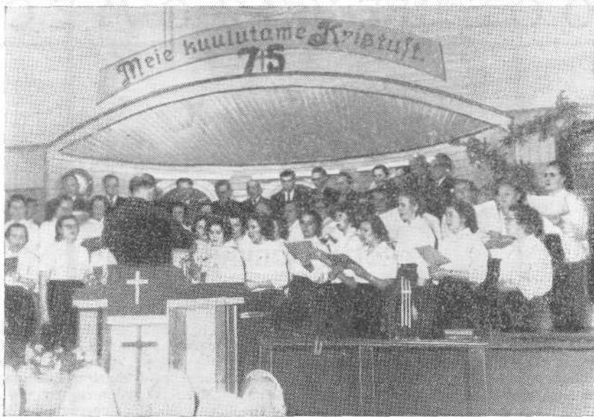
75-летие хора церкви ЕХБ г. Хаапсалу (Эстония)