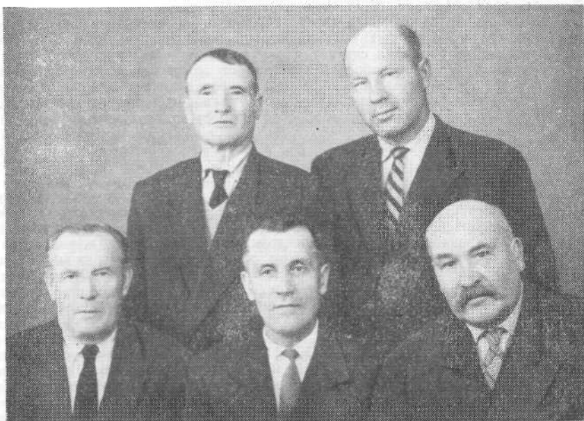
Руководство Воронежской церкви евангельских христиан-баптистов

С 13 по 19 сентября 1964 года в Афинах проходила Двенадцатая Конференция «Экумене и современная социальная работа». Приводится и другой информационный материал.