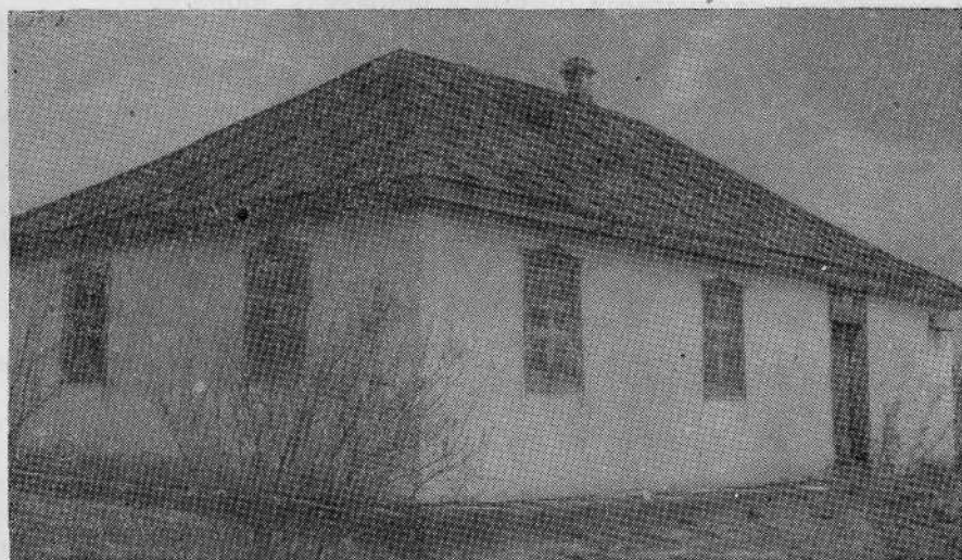
Молитвенный дом Мовчанивской общины евангельских христиан-баптистов (Рокитянский район, Киевской области)