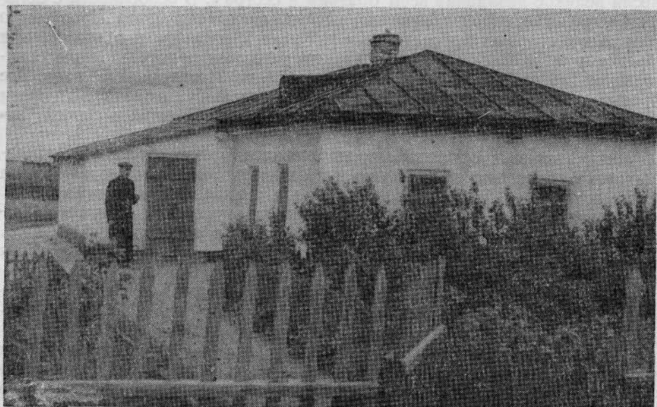
Молитвенный дом Сокологорненской общины евангельских христиан-баптистов (Чепичевский район, Херсонской области)