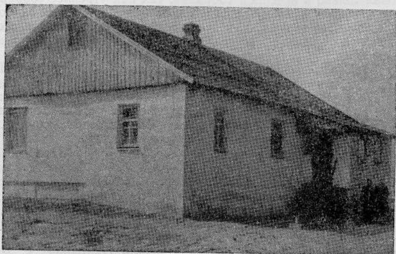
Молитвенный дом Дарницкой общины евангельских христиан-баптистов (Киев)