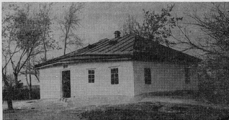
Молитвенный дом Иванковской общины евангельских христиан-баптистов (Кагарлыкский район, Киевской области)