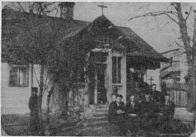
Молитвенный дом общины евангельских христиан-баптистов в городе Равва Русска (Львовская область)

Частная жизнь пастыря во всем должна согласоваться с его общественным духовным служением в церкви и окружающим его людям! Иначе скоро зайдет его солнце, и тогда — чем скорее отстранится он от своего дела, тем лучше, так как, оставаясь на своем посту, он может только опозорить свое высокое служение. Итак, пусть перед нашим внутренним взором будут постоянно начертаны слова ап. Павла: «Вникай в себя и в учение!»