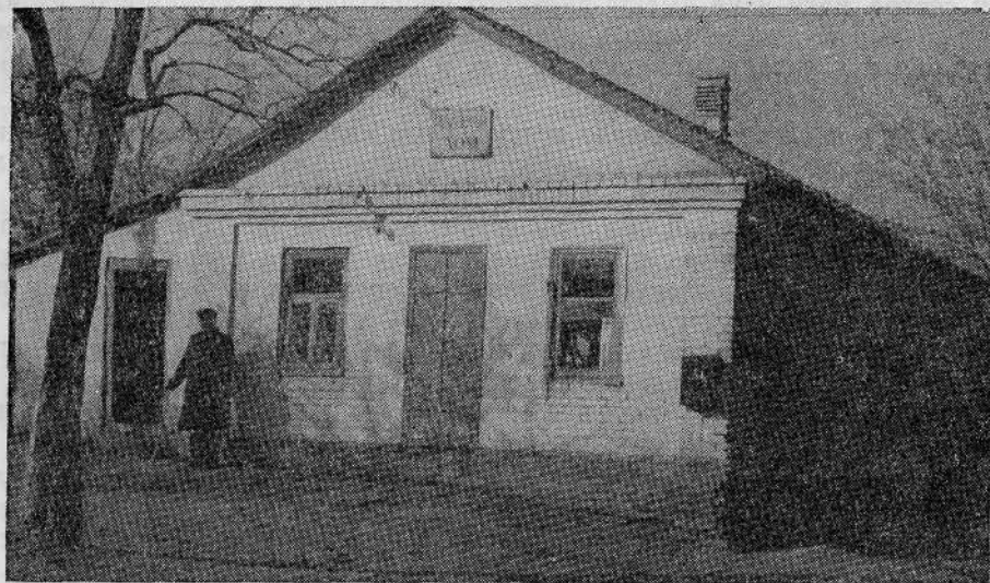
Молитвенный дом общины евангельских христиан-баптистов в г. Жданове (Сталинская область)

Итак, ближе ко Христу, чтобы было больше плодов!