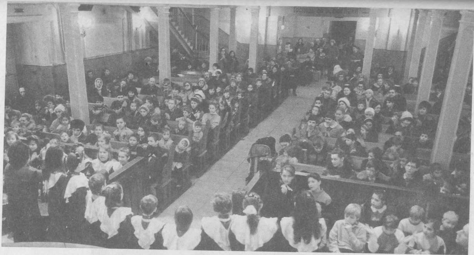
Богослужение Центральной Московской церкви для воспитанников школ-интернатов