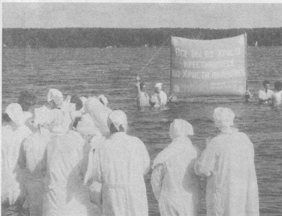
Крещение новых членов церкви г.Мытищи Московской обл.