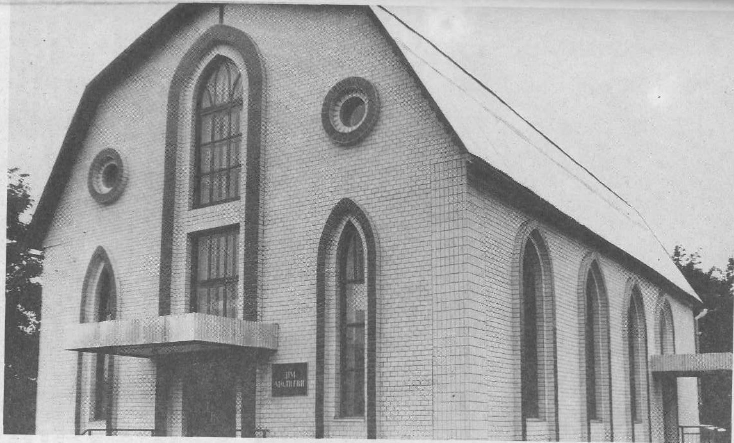
Молитвенный дом церкви г.Черкаassy