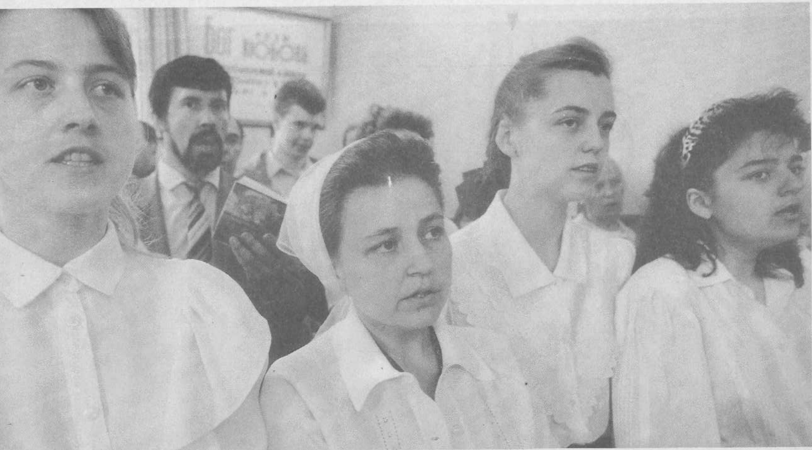
Богослужение церкви г.Мытищи