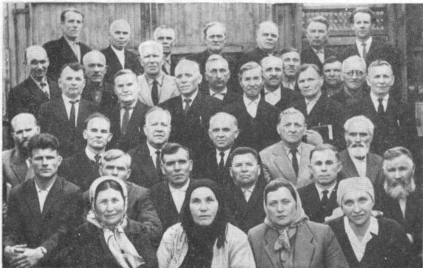
Совещание служителей церквей ЕХБ Восточной Сибири. 7—8 мая 1967 года