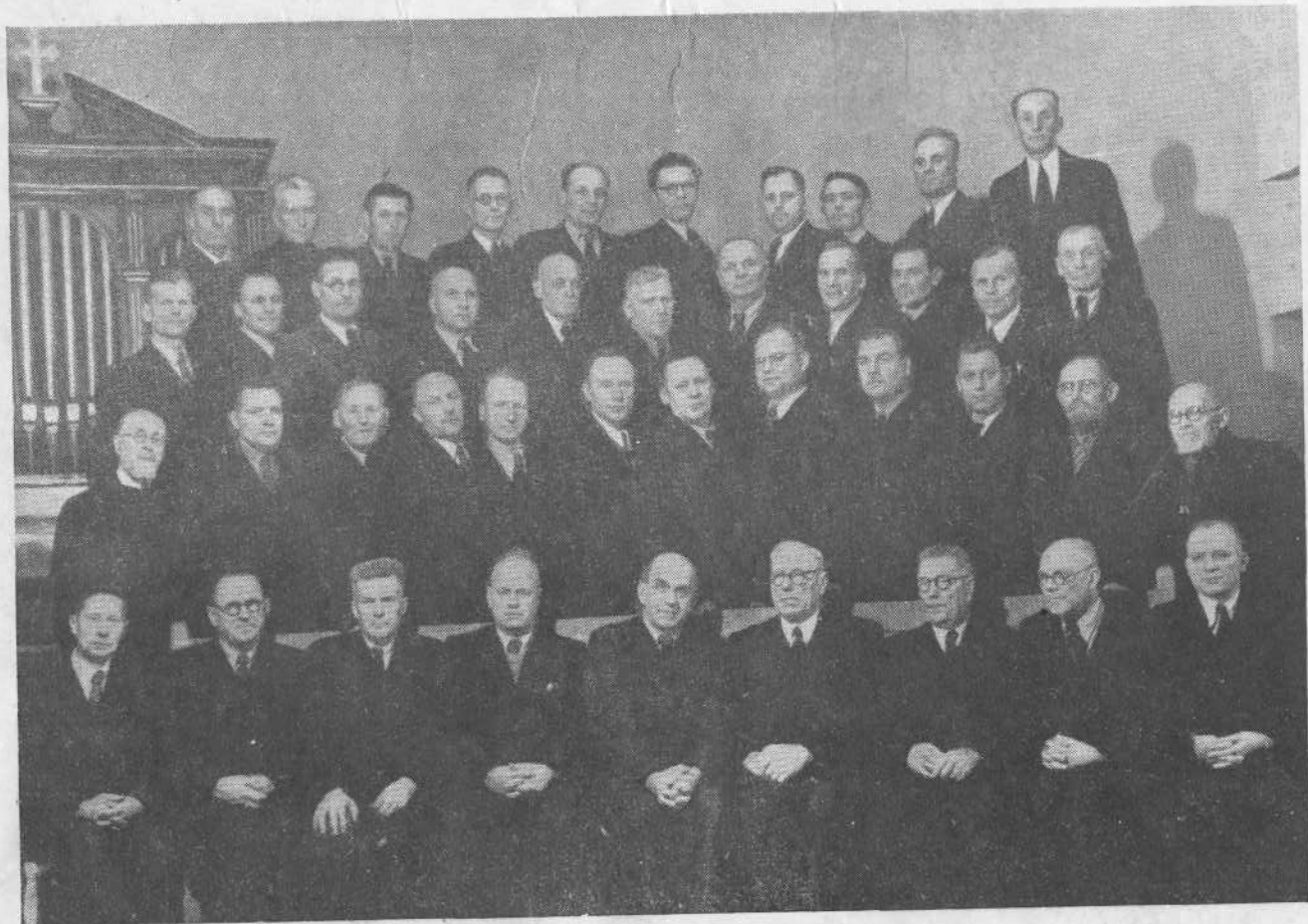
Баптистские пресвитеры Латвии во время совещания в Риге в октябре 1953 года