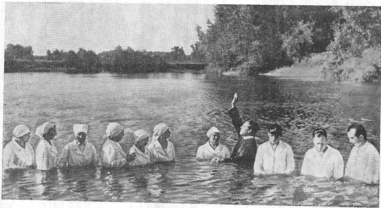
Крещение новых членов Полтавской церкви.