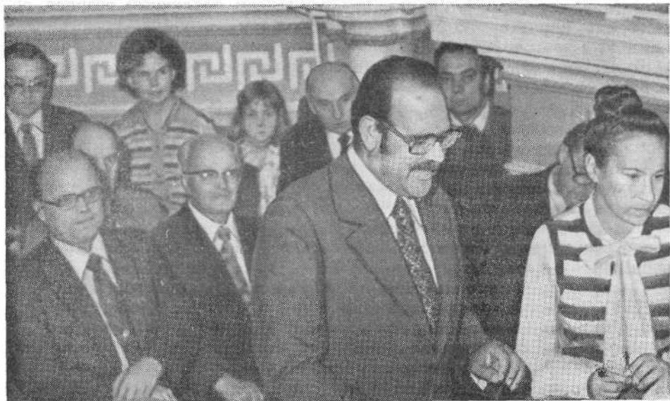
Президент Союза баптистов Испании Х. Торрас обращается со словом приветствия и назидания к верующим Московской церкви.