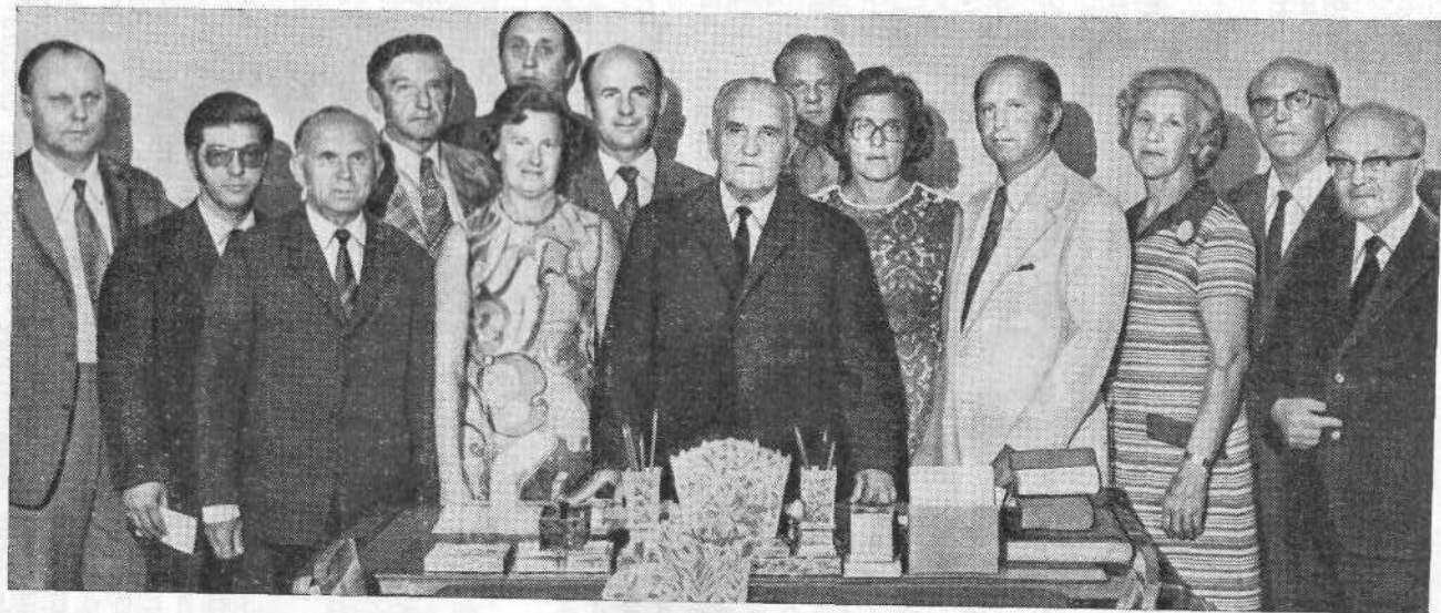
Норвежские братья и сестры по вере в канцелярии ВСЕХБ