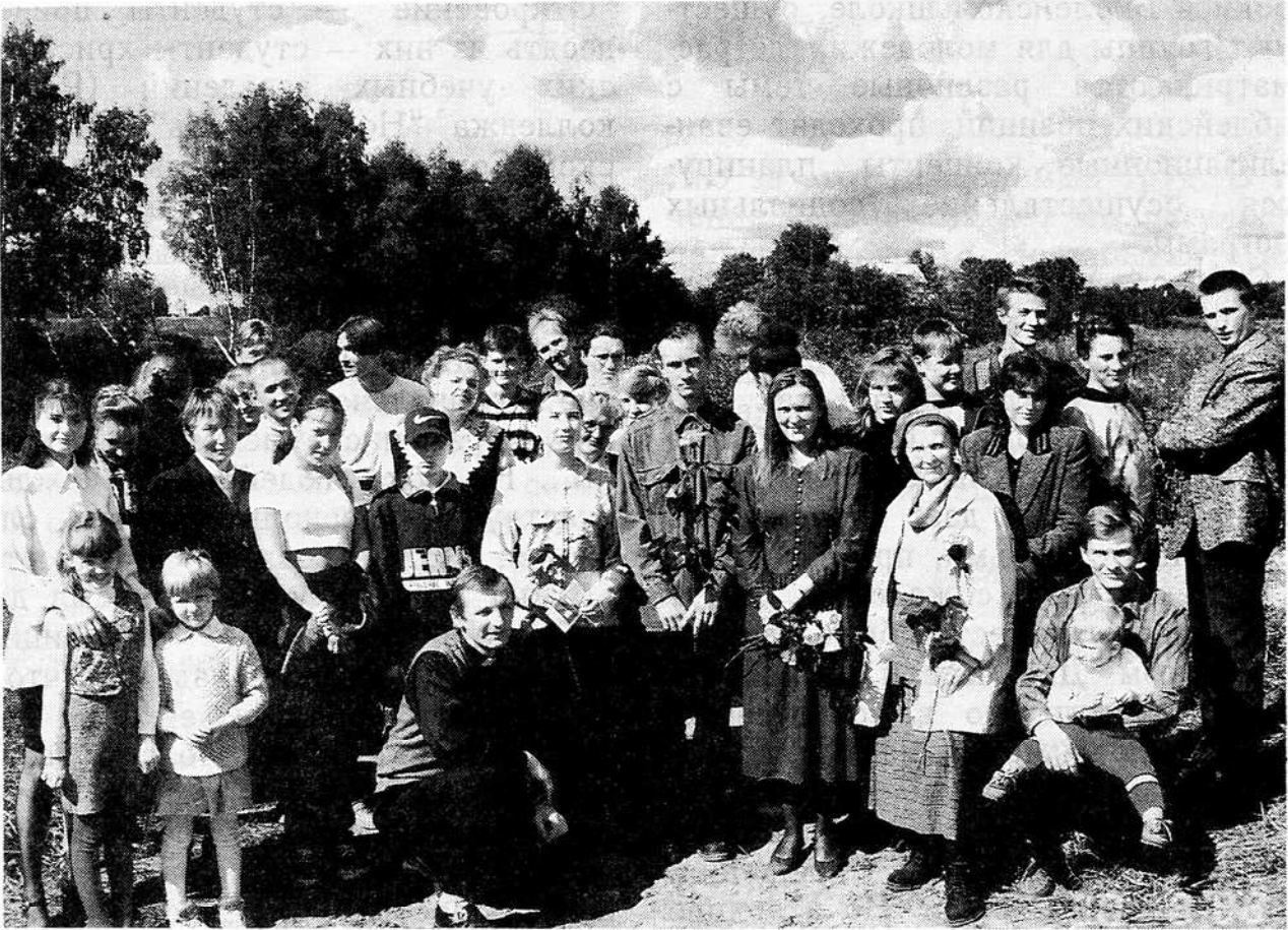
Верующие церкви "Откровение" города Истры Московской области

Что значит "откровение"? Это "... то, что неожиданно раскрывает истину, неожиданно делает совершенно ясным, понятным что-нибудь".* В чем заключается откровение Божие людям? В законе, данном на горе Синай? В удивительном Исходе из Египта? Иисус Христос — Откровение Божие. В Нем Бог явил Свою милость и любовь. Высшее проявление этой любви — смерть Христа.