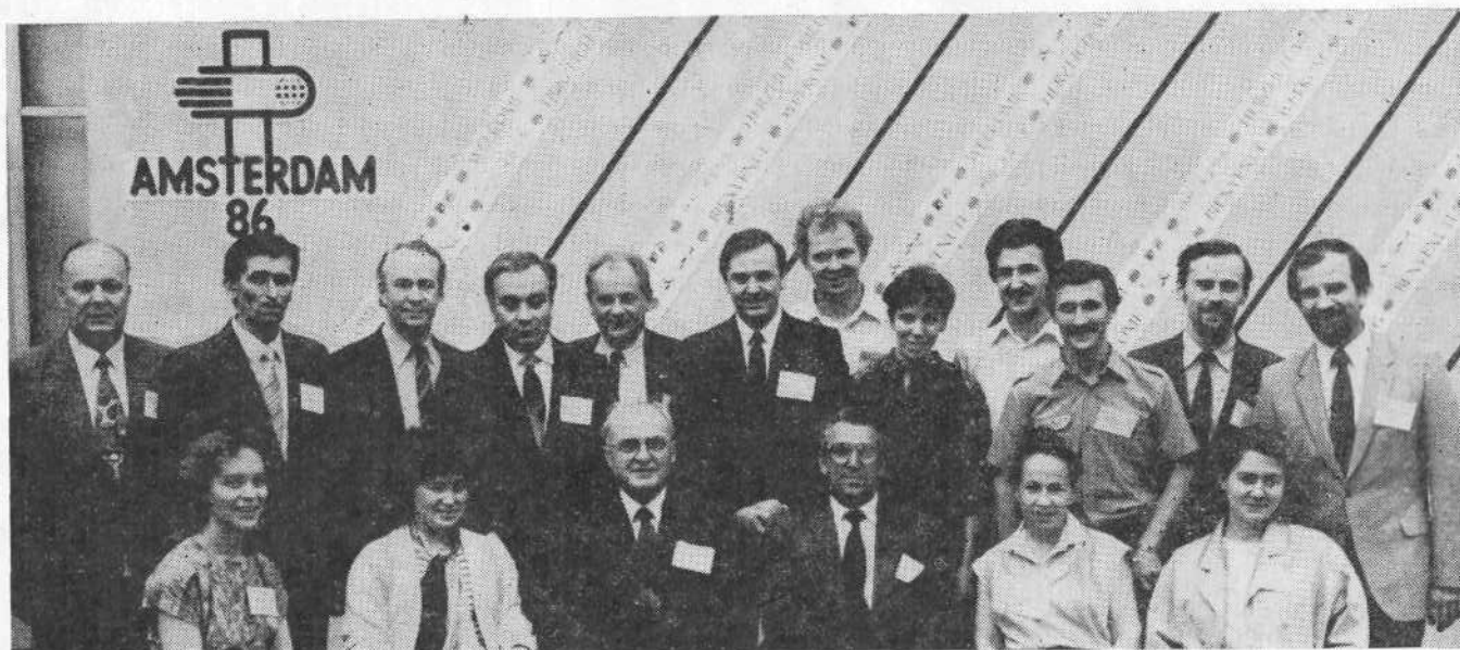
Делегация ВСЕХБ, принимавшая участие во Всемирной конференции евангелистов.