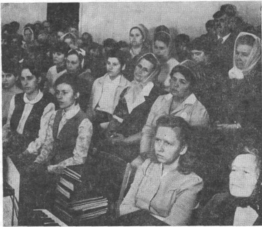
Богослужение в Никопольской церкви.

Брат родился в 1910 году в Воронежской области в семье крестьянина-батрака.