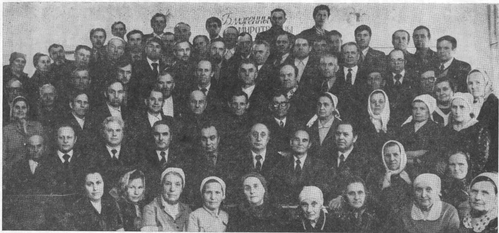
Участники семинара представителей церквей Красноярского края и Тувинской АССР.