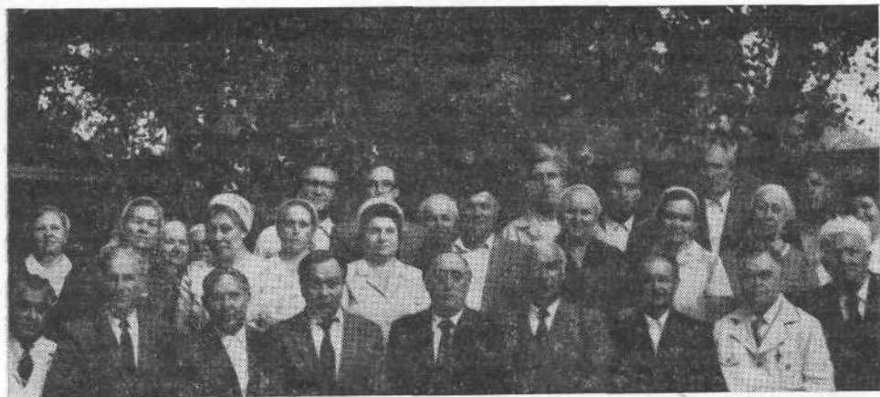
Представители ВСЕХБ среди верующих церкви города Минеральные Воды.