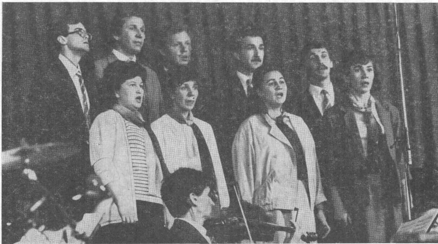
Группа хористов от Союза евангельских христиан-баптистов выступает перед участниками конференции евангелистов в Амстердаме.