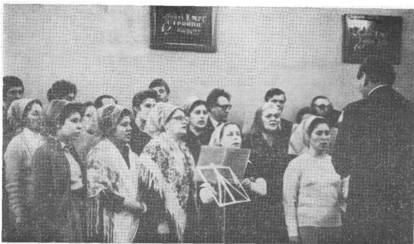
Хор церкви города Калининграда.