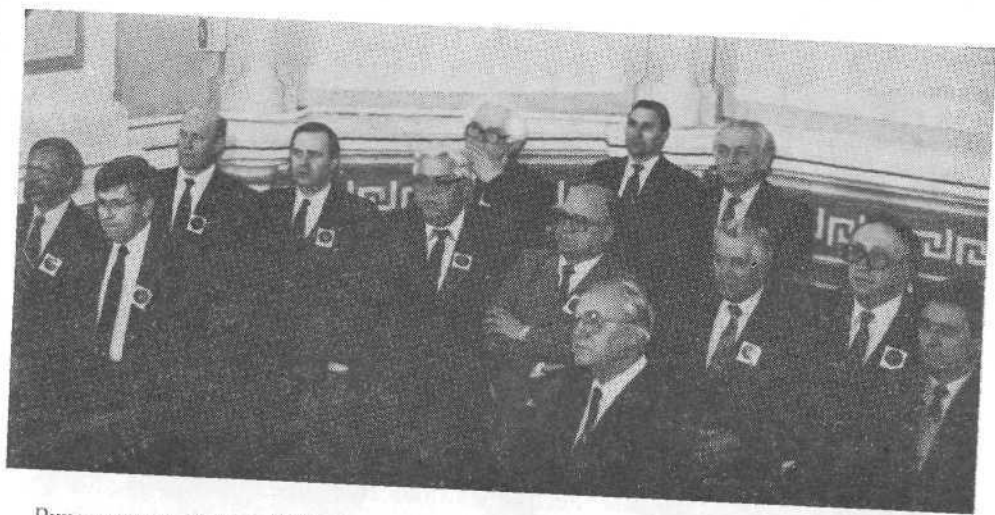
Руководящие братья ВСЕХБ и зарубежные гости на кафедре Московской церкви.

шею в работе конференции. Он выразил уверенность, что результаты конференции найдут широкий отклик в церквях нашего братства. «Встречи христиан, — закончил он, — являются надежными мостами между Востоком и Западом. В тяжелые годы холодной войны, когда были прерваны культурные и экономические связи, церковный канал работал для дела мира и установления доверия.