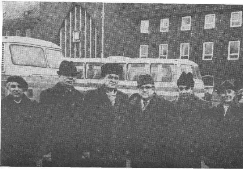
Представители ВСЕХБ среди служителей церкви города Калининграда.

вой и вместе с тем засвидетельствовал о великих благословениях, которые имели дети Божии.