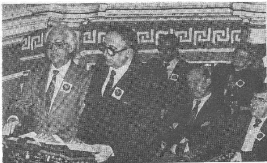
Генеральный секретарь Европейской баптистской федерации К. Вумпельман выступает на богослужении в Московской церкви.

жил избрать, кому служить; богам, которым служили их отцы, или живому Богу, Который вывел их из египетского рабства.