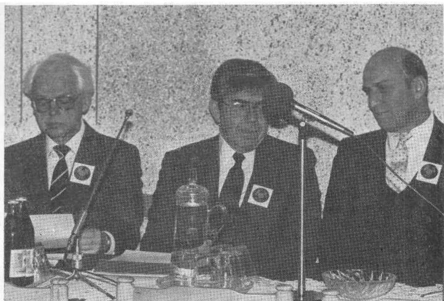
Пресс-конференция руководителей семинара.

единению человечества и освобождает огромные средства на нужды страждущих народов развивающихся стран.