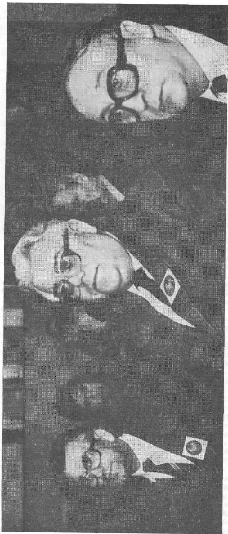
Участники международного семинара.