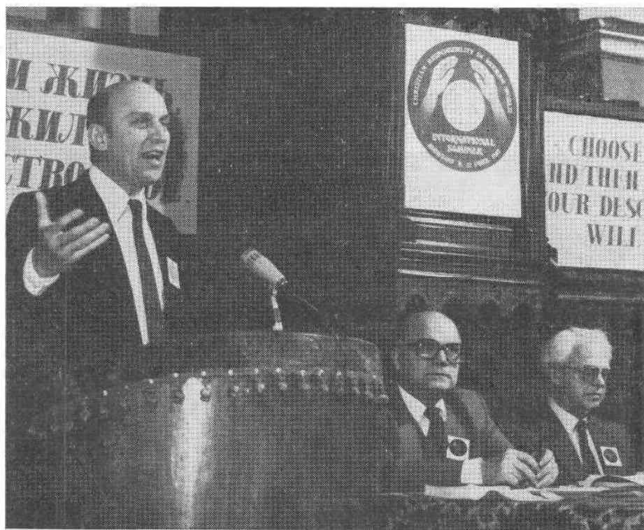
Заместитель генерального секретаря Всемирного союза баптистов Д. Лотц приветствует участников семинара.

В библейском размышлении на тему «Бог во Христе примирил с Собою мир... и дал нам слово примирения» — 2 Кор. 5, 14—20 — Я. Э. Тервиге призвал христиан к осознанию своей миссии в современном мире. Он сказал, что положение христиан является очень ответственным. Христос поручил нам нести служение примирения, которое заключается в утешении скорбящих, в исцелении ран человечества и самое главное — в примирении людей с Богом и друг с другом.