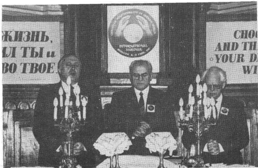
Хлебопреломление для участников семинара.

На следующий день для участников семинара было совершено хлебопреломление.