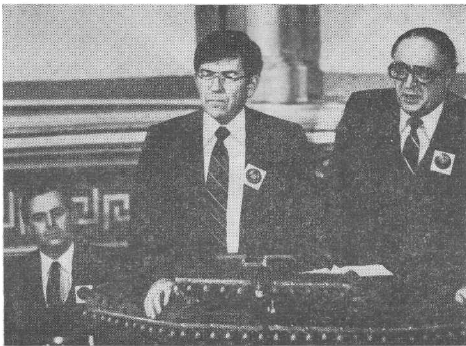
П. Крейбл, генеральный секретарь Всемирной конференции менонитов, выступает на богослужении в Московской церкви.

Участникам Круглого стола были заданы вопросы, касающиеся отношения христиан к возрастанию угрозы уничтожения мира и определения отношения к мирным инициативам и к мораторию Советского правительства.