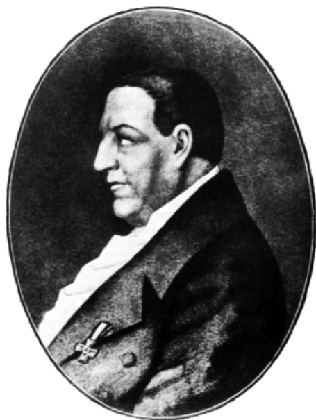
Ф. П. Гааз

Предавшись заботе об участии арестантов с неиссякающей любовью и неустанной энергией,