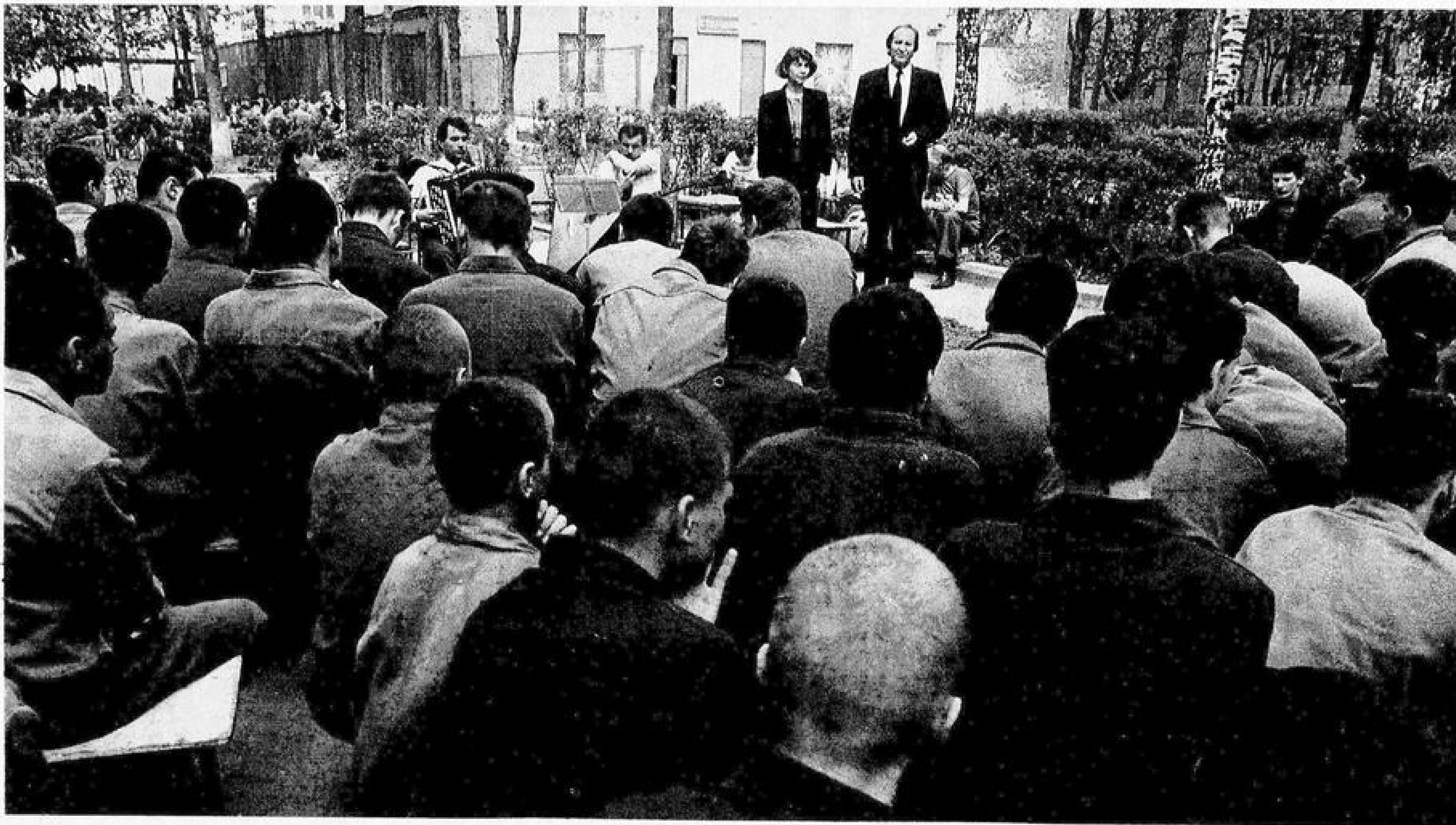
Музыкальная группа "Благовестие" выступает в мужской колонии