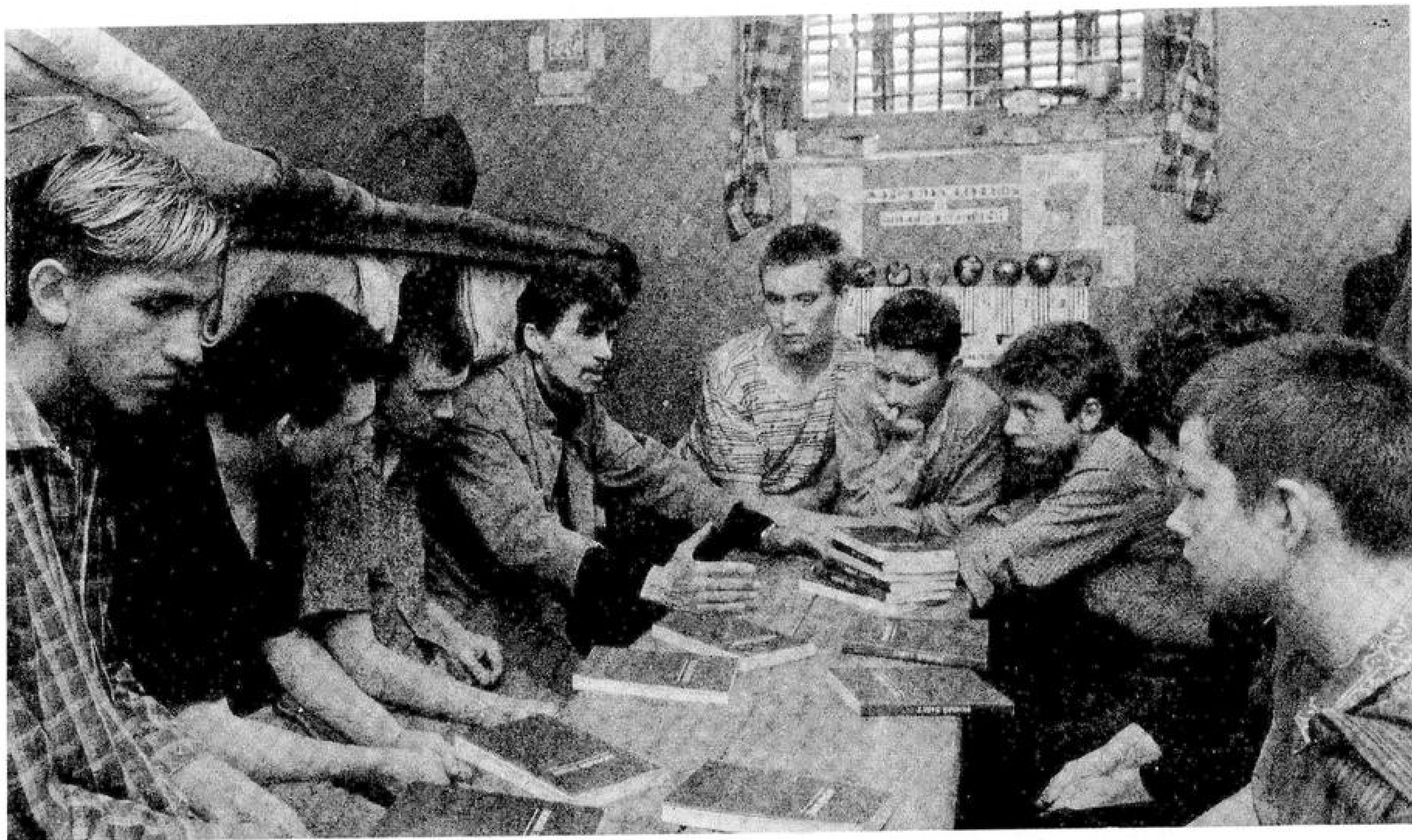
Свидетельство о Господе среди узников