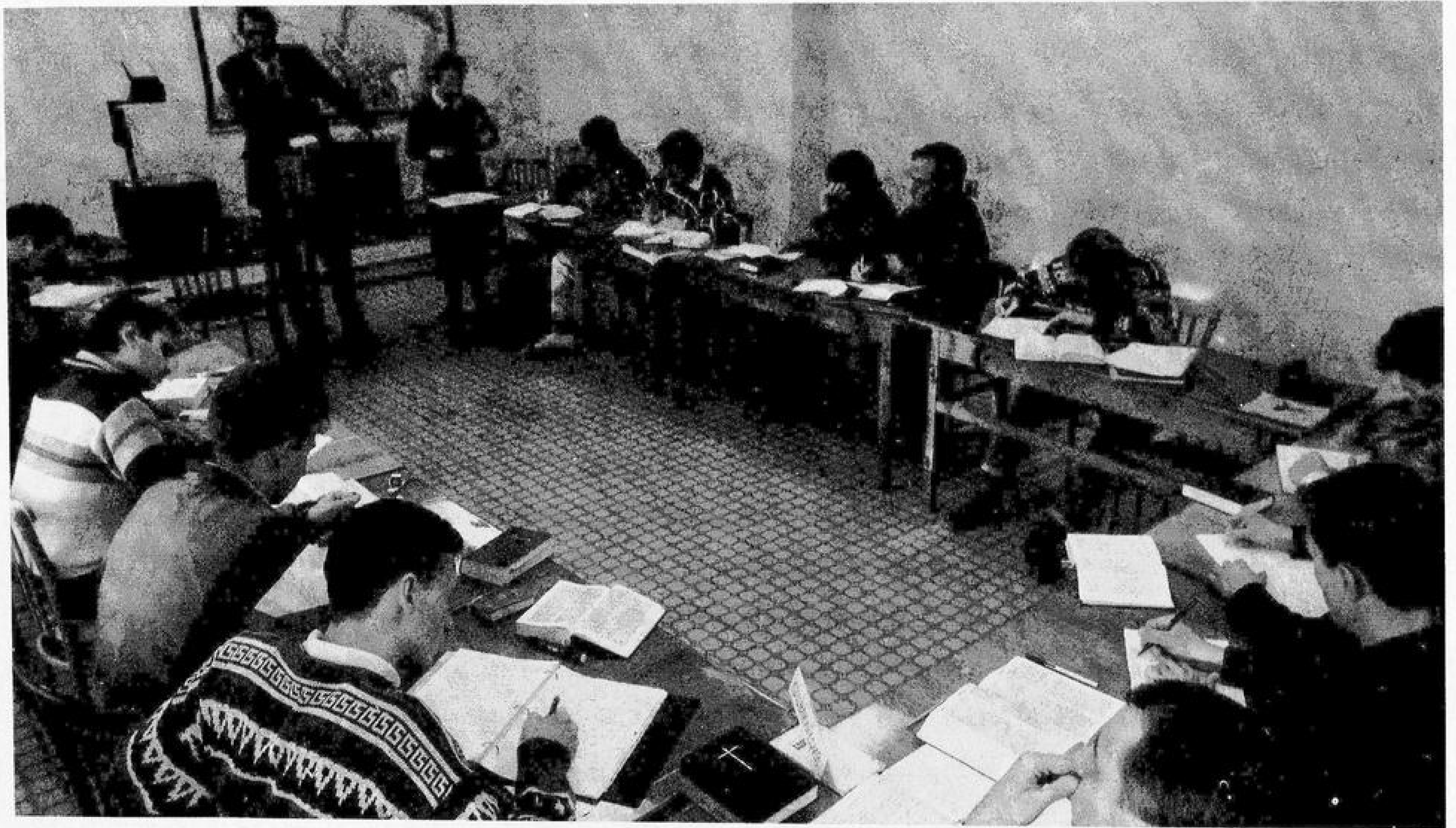
Занятия в Московской духовной семинарии