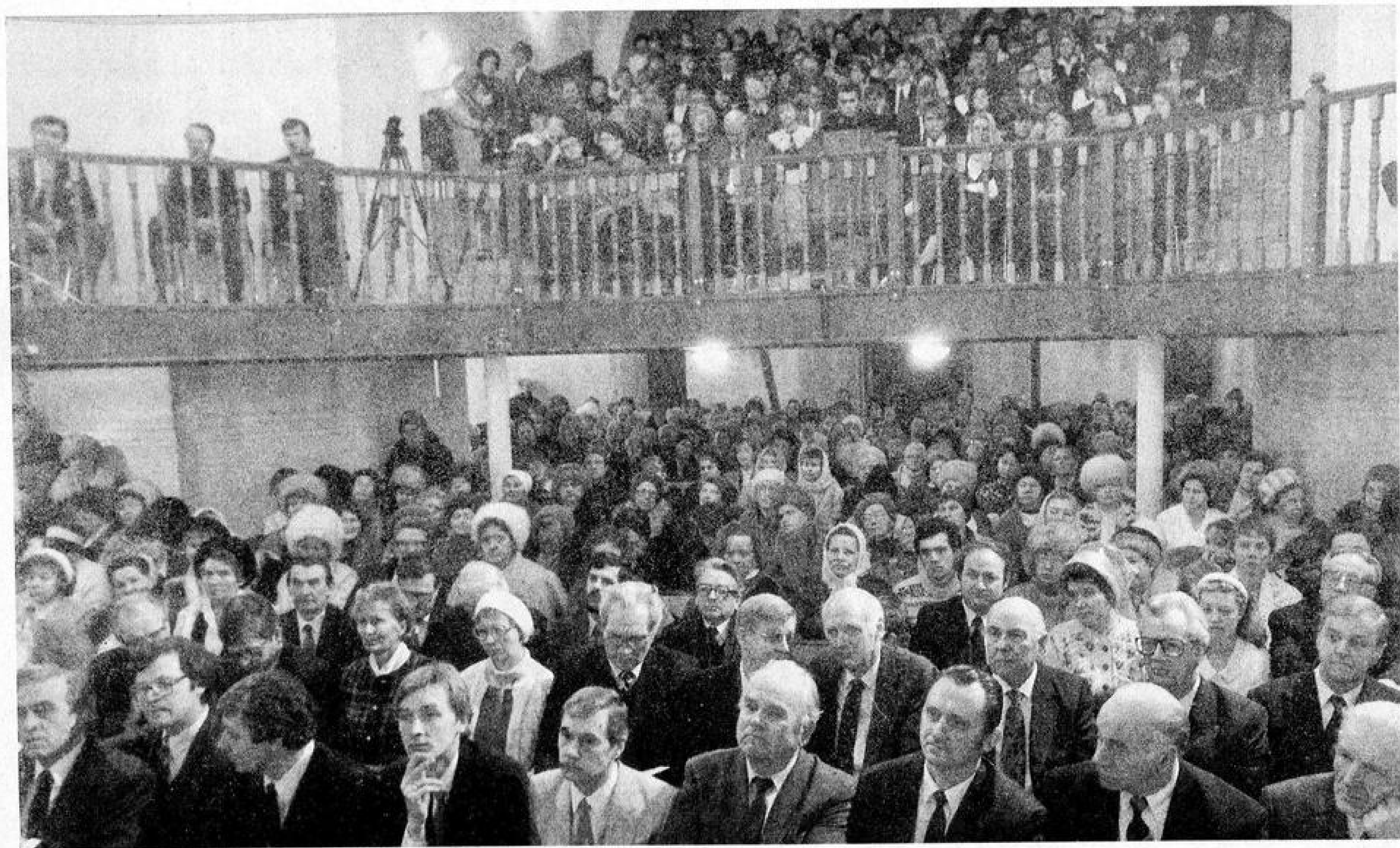
Богослужбное собрание Санкт-Петербургской церкви на Боровой