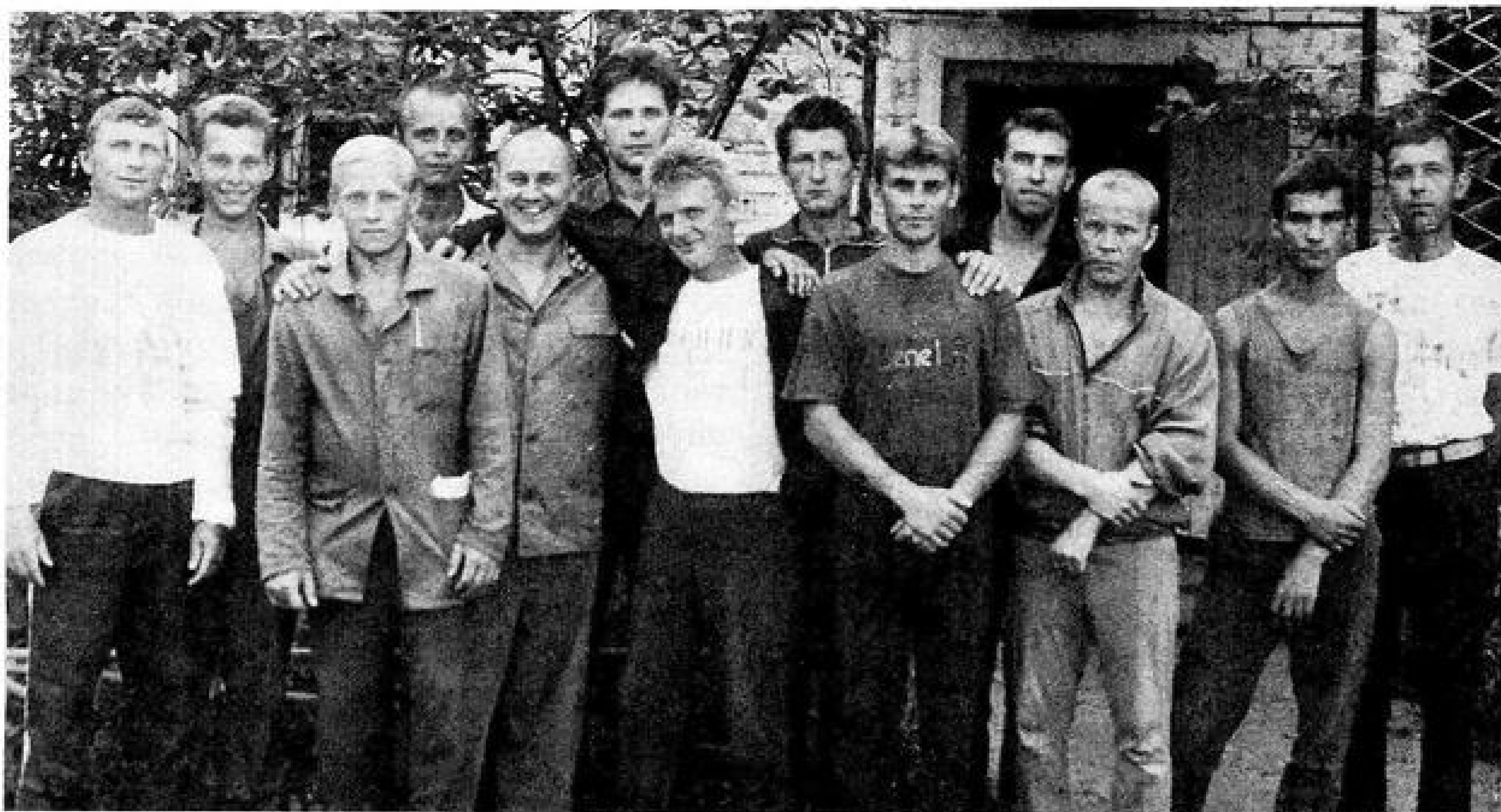
Группа верующих узников

просьбой. Очень хотелось бы получать Ваш журнал в этом году, так как я заинтересовалась публикациями "Царь из дома Давида" и Библейскими уроками для воскресных школ. Я очень плохо знаю Библию, поэтому эти публикации мне крайне интересны.