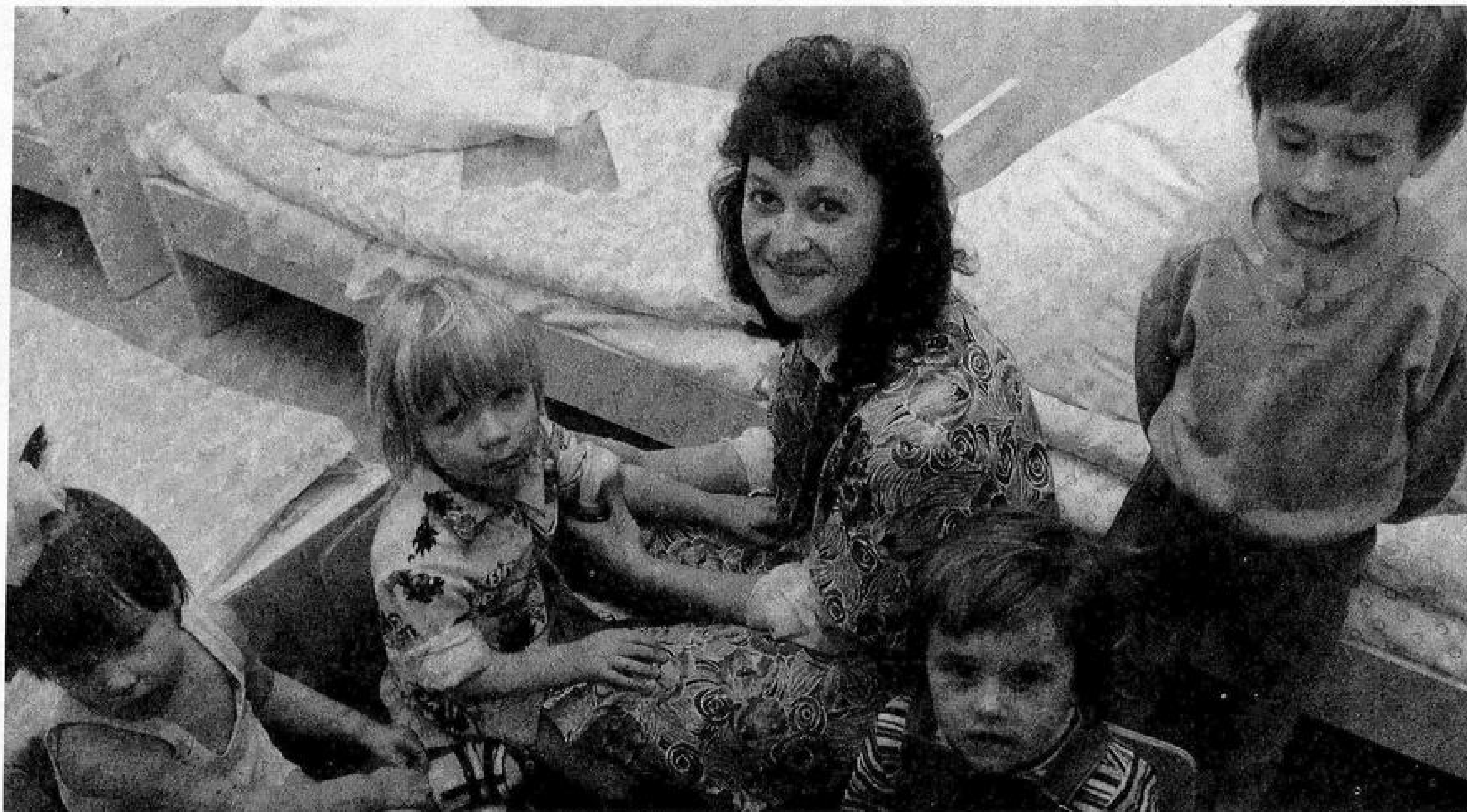
Занятия в христианском детском садике