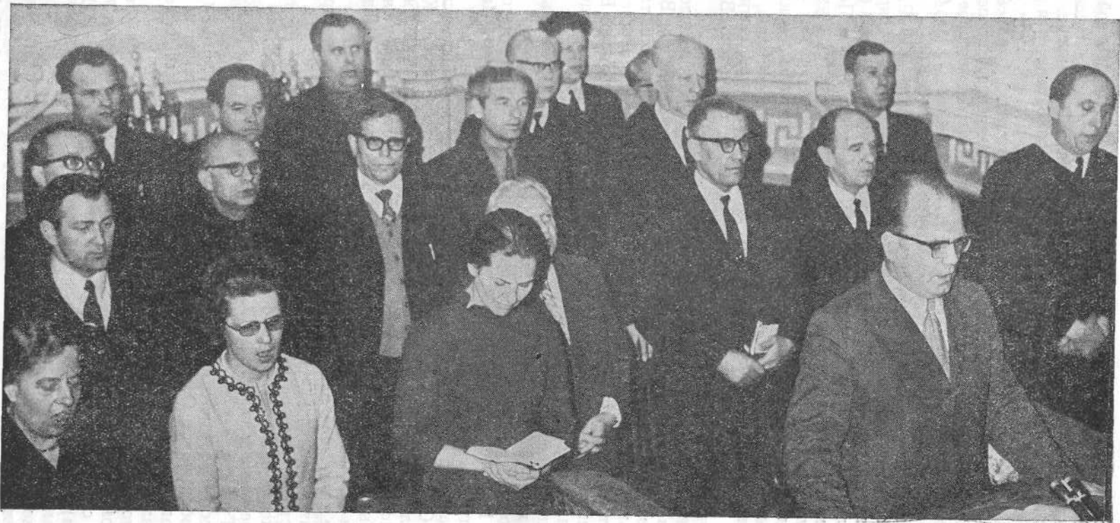
Сестры по вере из ФРГ на богослужении Московской церкви