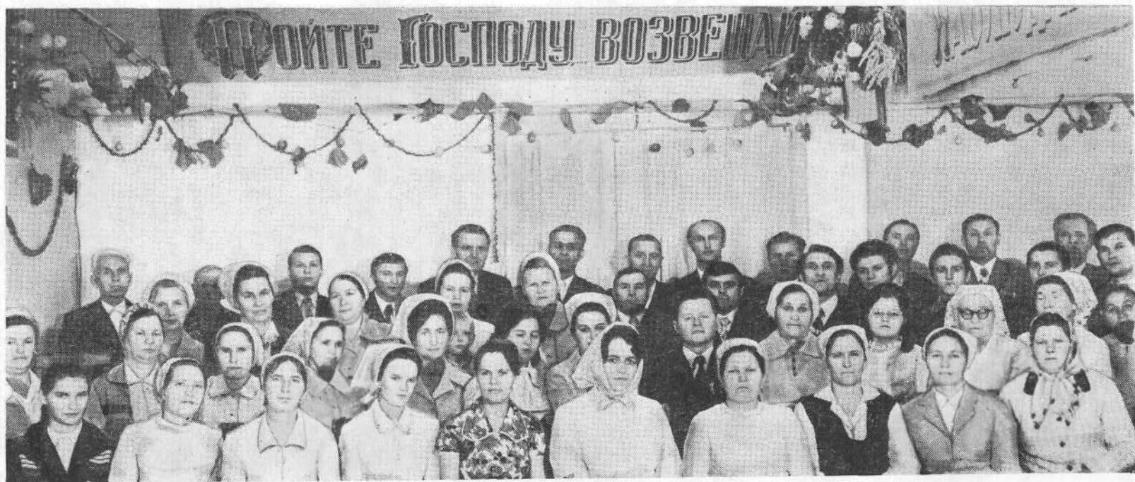
Хористы Харьковской церкви.