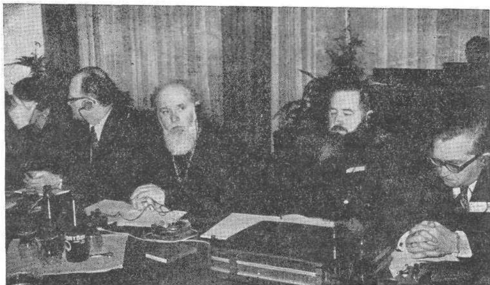
Делегация церквей СССР на собеседовании с руководством Всемирного Совета церквей.