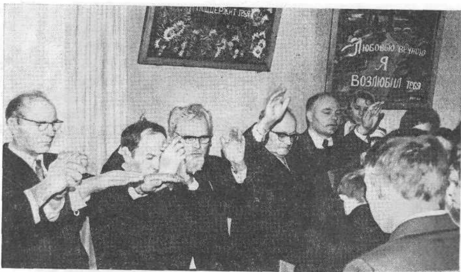
Освящение молитвенного дома Новгородской церкви.