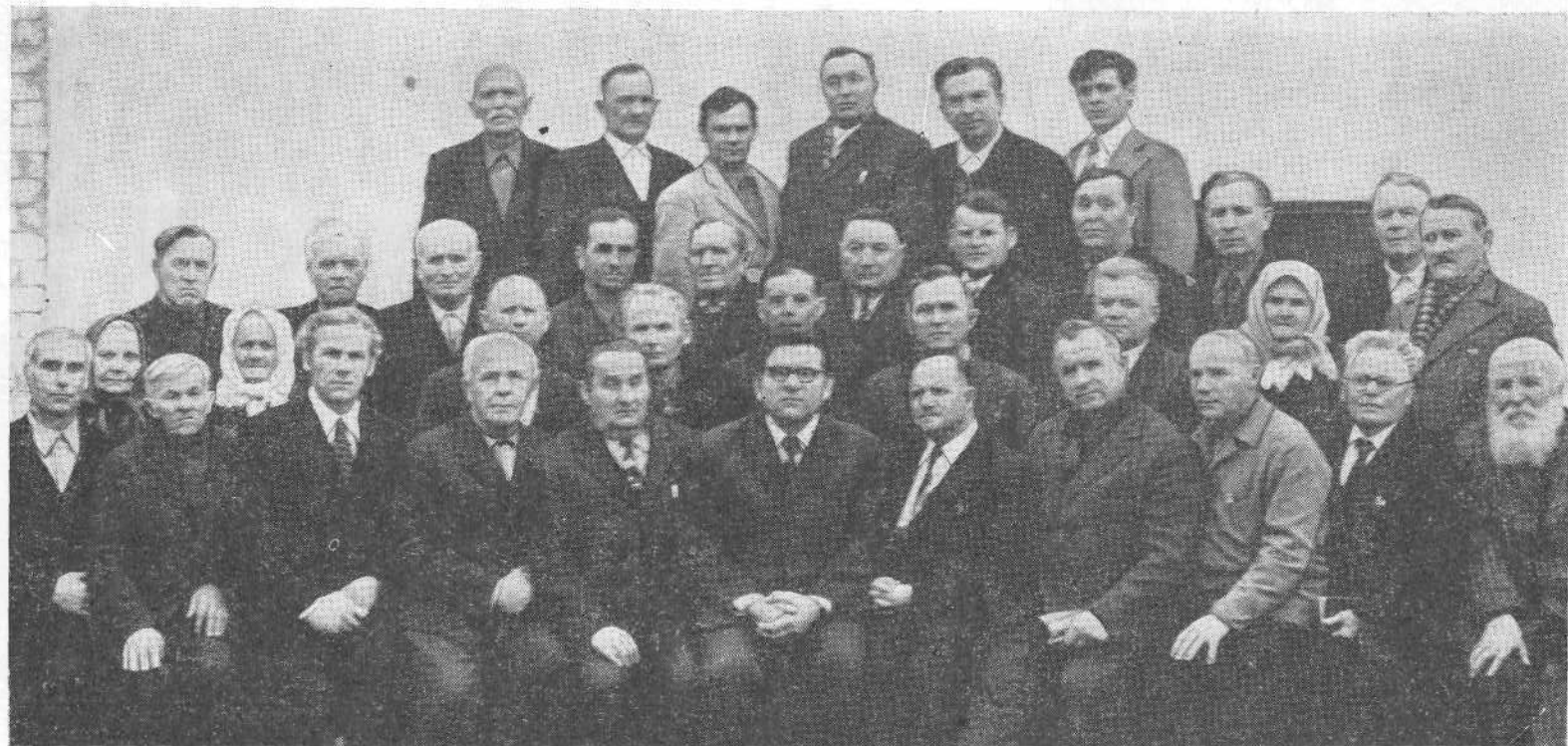
Участники совещания представителей церквей Ставропольского края.